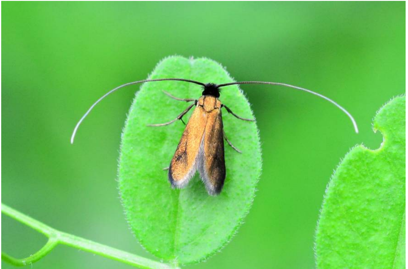
© Rotsilberne Langhornmotte ( Cautas rufimitrella ), Wolfgang Schruf