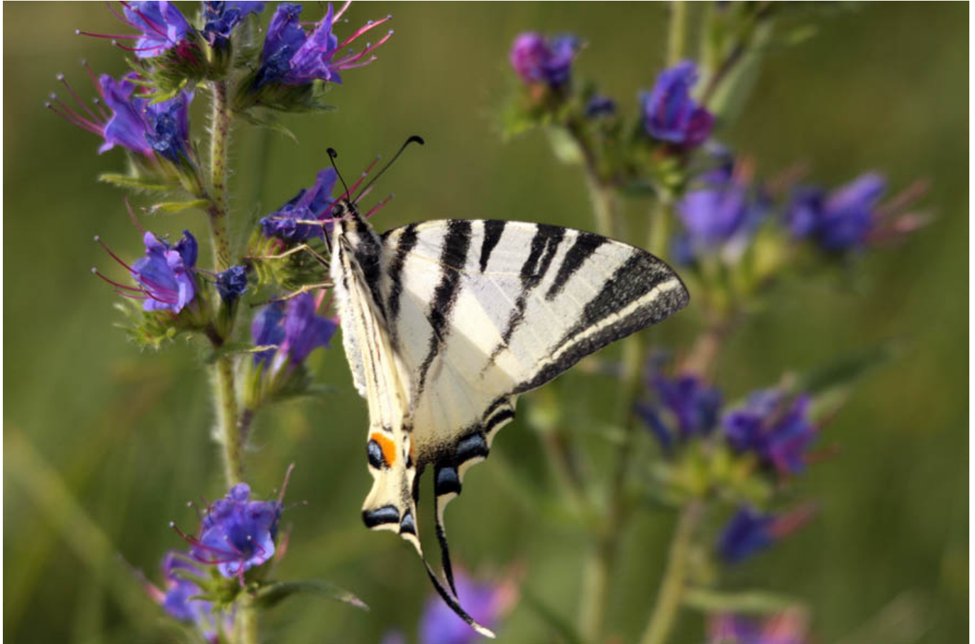
Segelfalter