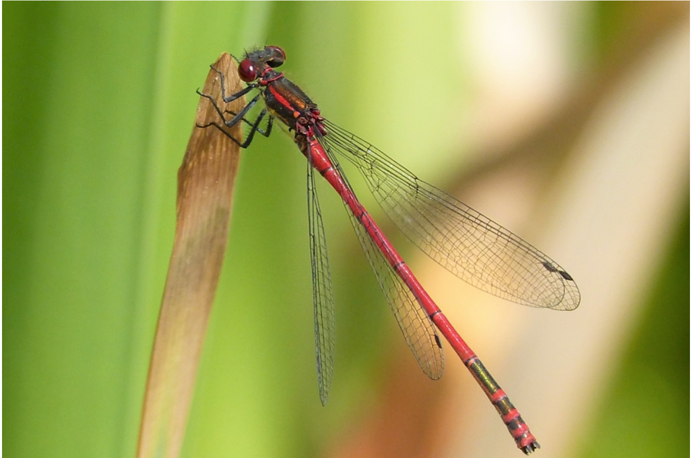
Frühe Adonislibelle

Im Prießnitztal wurden vom Schöffelverein vor vielen Jahren Teiche angelegt. Sie haben sich zu einem Eldorado v. a. auch für Libellen entwickelt. Andreas Chovanec weiß viel Spannendes aus der vielfältigen Biologie dieser Insektengruppe zu erzählen. Zudem werden wir auch erfahren, auf welche Merkmale man beim Bestimmen der Arten besonders achten muss.