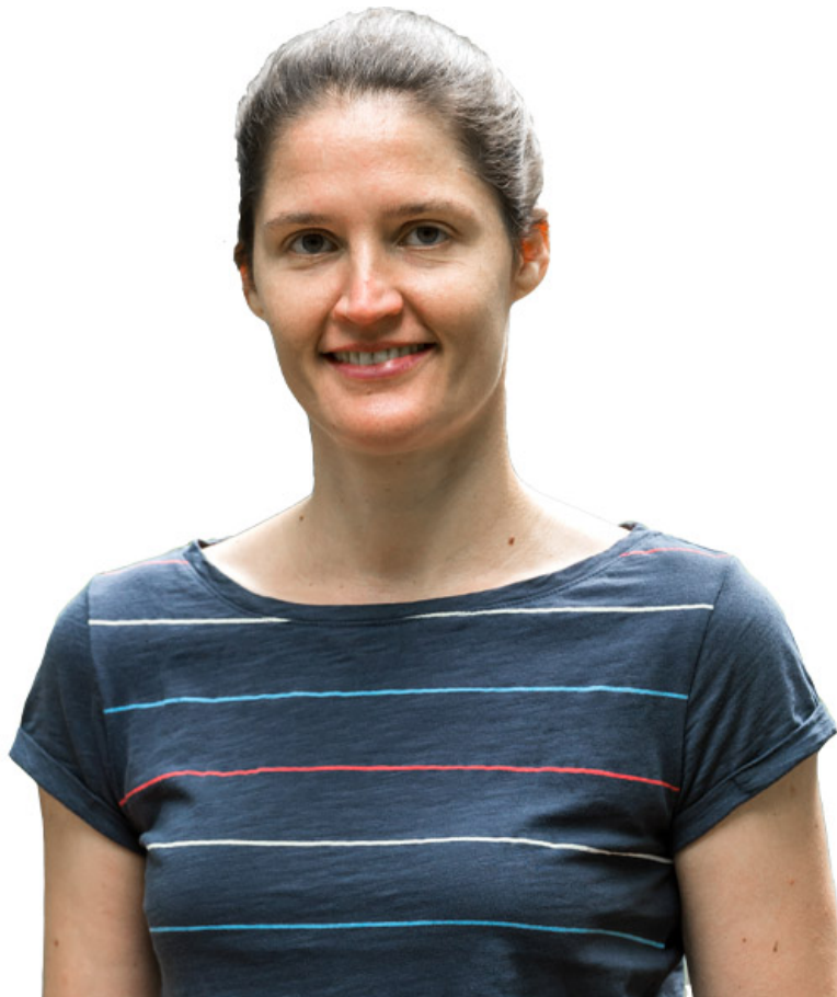
_ Kreutz: Das "Grüne Band Europa" als Modell für Grüne Infrastruktur