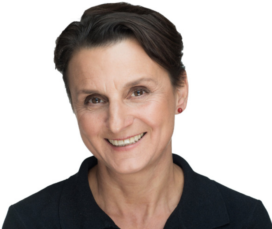
_ DI Polak: Lebensräume vernetzen in privatem und öffentlichem Grün