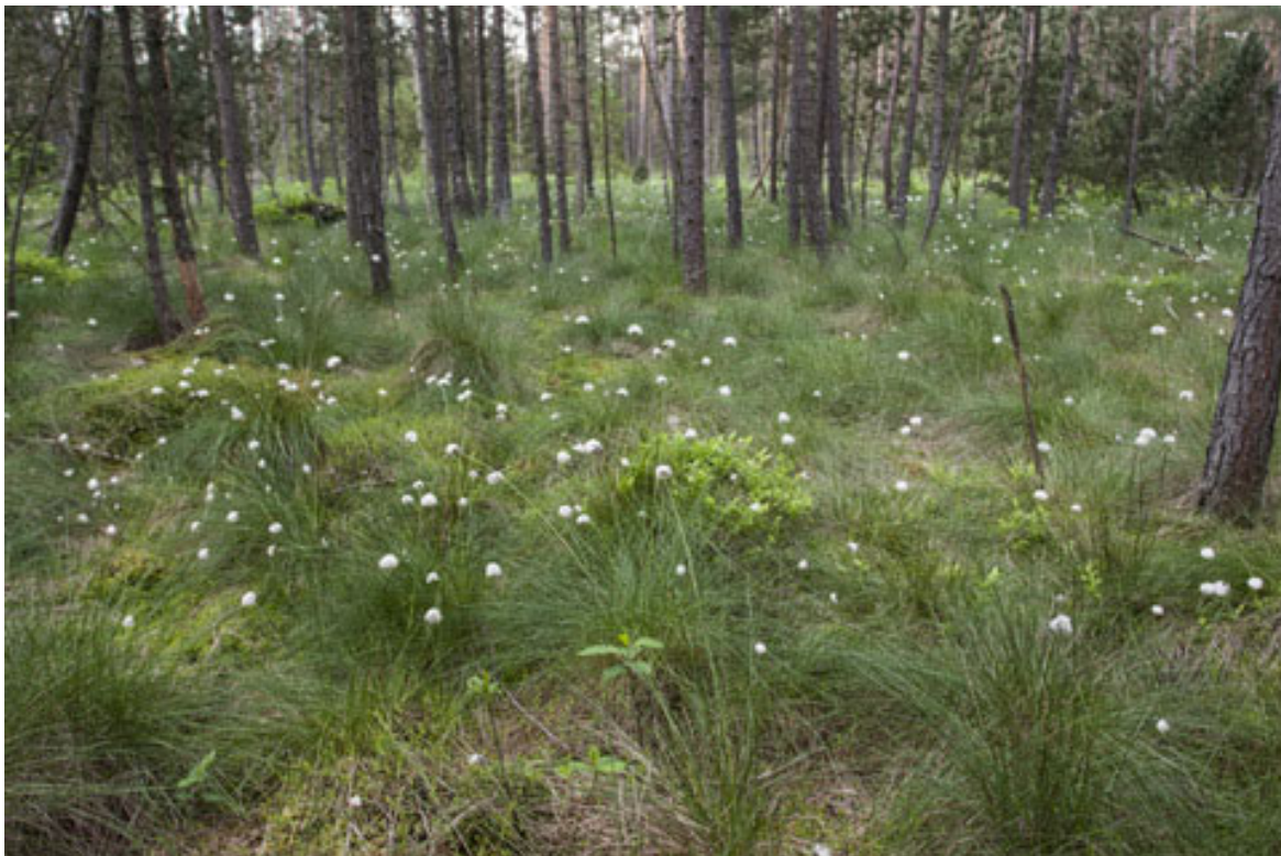
Abbildung 1: Scheidiges Wollgras im Gebhartser Moorwald

Der Naturschutzbund NÖ konnte im Jahr 2020 5,05 ha dieses wertvollen Gebiets durch Ankauf sichern, 3,04 ha wurden privat angekauft und stehen über einen langjährigen Nutzungsvertrag mit dem Naturschutzbund NÖ ebenfalls für den Moor- und Artenschutz zur Verfügung. Im Rahmen des Interreg VA-Projektes ConNat (Crossborder Habitat Network and Management - Connecting Nature AT-CZ) wurden 2018 bis 2020 vegetationskundliche und hydrologische Untersuchungen zur Erstellung eines Konzepts zur Vorbereitung von Moorsanierungsarbeiten durchgeführt (PFUNDNER, 2021 IN PREP). Maßnahmen sollen in nachfolgenden Projekten umgesetzt werden.