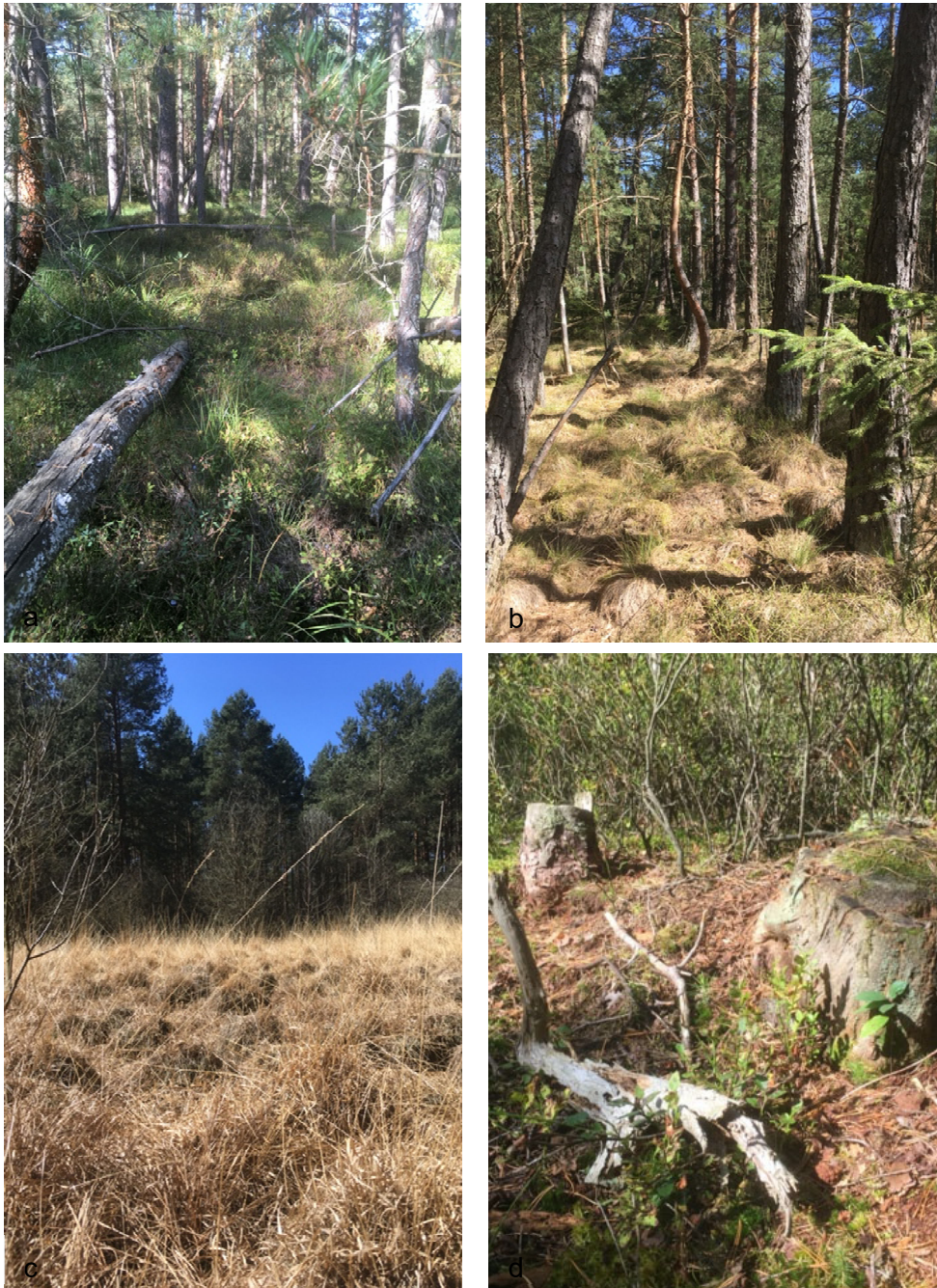
Abbildung 4. Lebensräume im Moorwald Gebharts: a) Rotföhrenwald mit Heidelbeeren und liegendem Totholz; b) Rotföhrenwald mit überwachsenen Moospolster; c) offene Moorfläche/Lichtung mit Moospolster, d) strukturreiches Teilhabitat mit Totholz und Heidelbeeren.