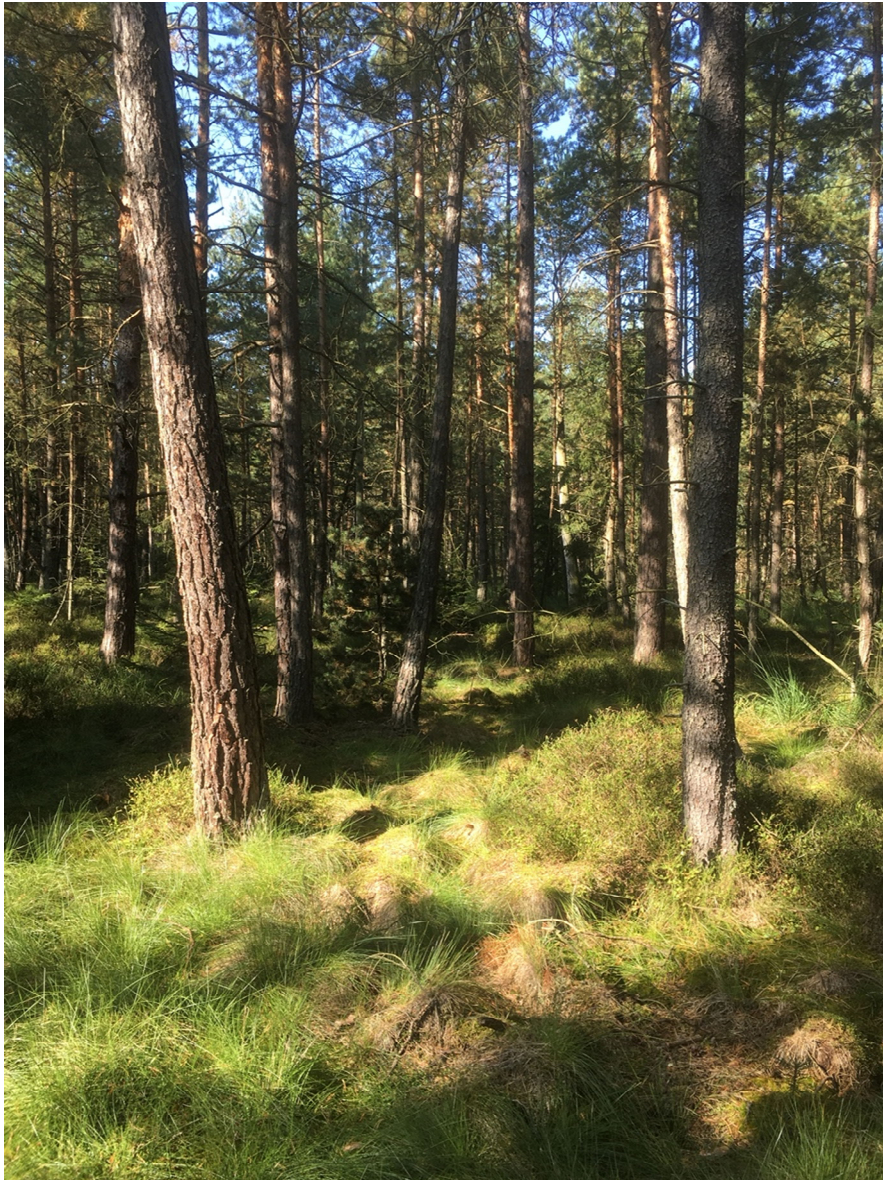
Abbildung 5. Typisches Lebensraumbild im Moorwald Gebharts Nord.