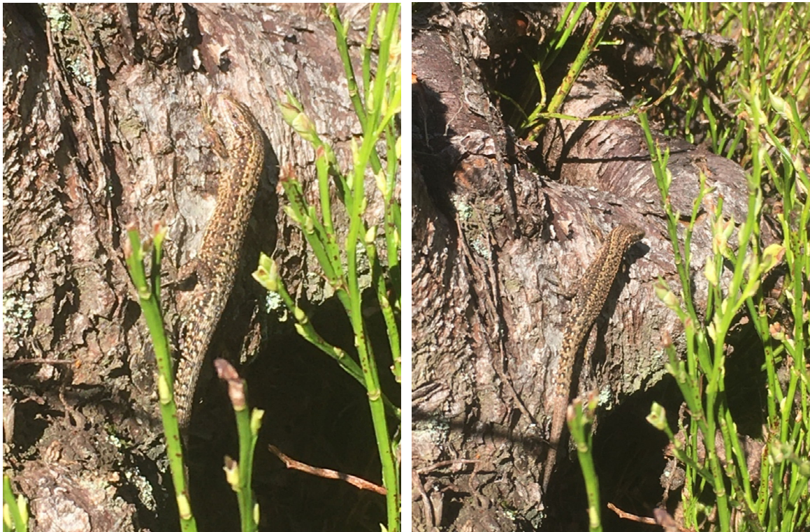
Abbildung 3: Eine Bergeidechse ( Zootoca vivipara ) gesichtet auf Totholz.