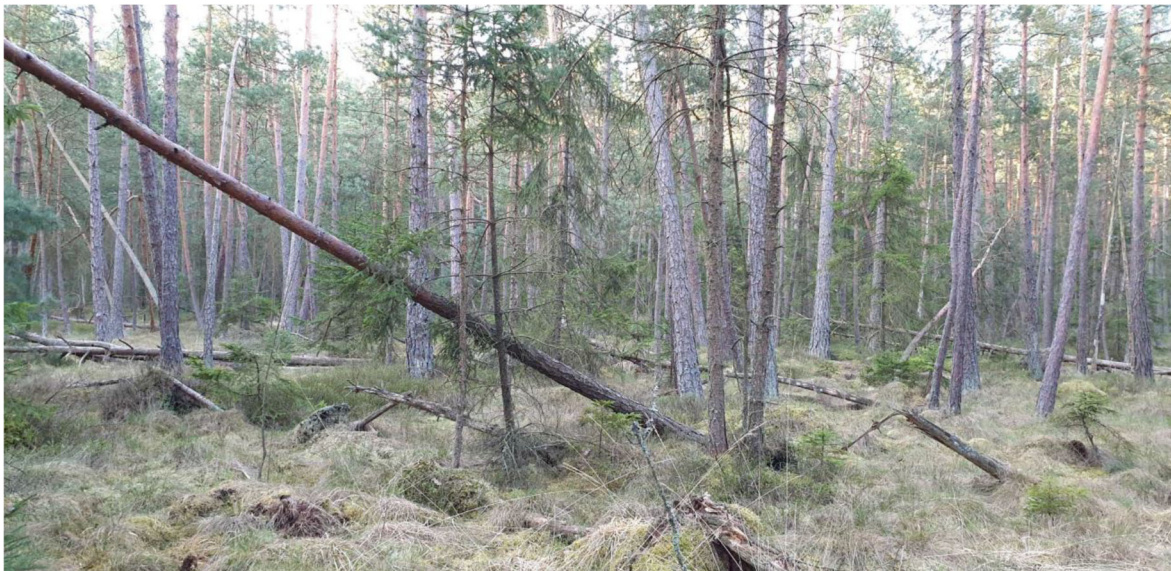
Abbildung 6. Typisches Lebensraumbild im Moorwald Gebharts Nord.

Im Untersuchungsgebiet konnte keine Waldschnepfe nachgewiesen werden. Prinzipiell handelt es sich bei der Waldschnepfe um eine weitverbreitete Brutvogelart des Waldviertels, deren Bestand sich in den letzten Jahren stark positiv entwickelt hat (eigene Beobachtungen). Waldschnepfen bevorzugen (feuchte) reich gegliederte Waldbestände. Moore mit hoch anstehendem Grundwasser und überwiegend moosigen Untergrund stellen keine optimalen Bedingungen für diese Art dar. Um diese Art im Untersuchungsgebiet zu fördern müssten Teile des Moores trockengelegt werden.