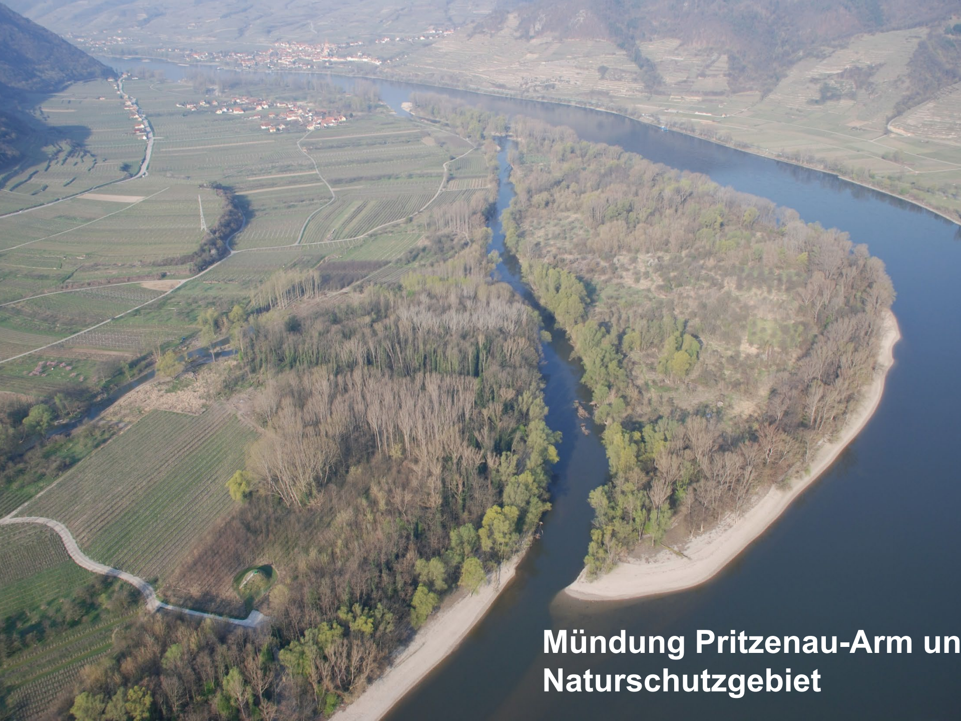
Mündung Pritzenau-Arm un Naturschutzgebiet