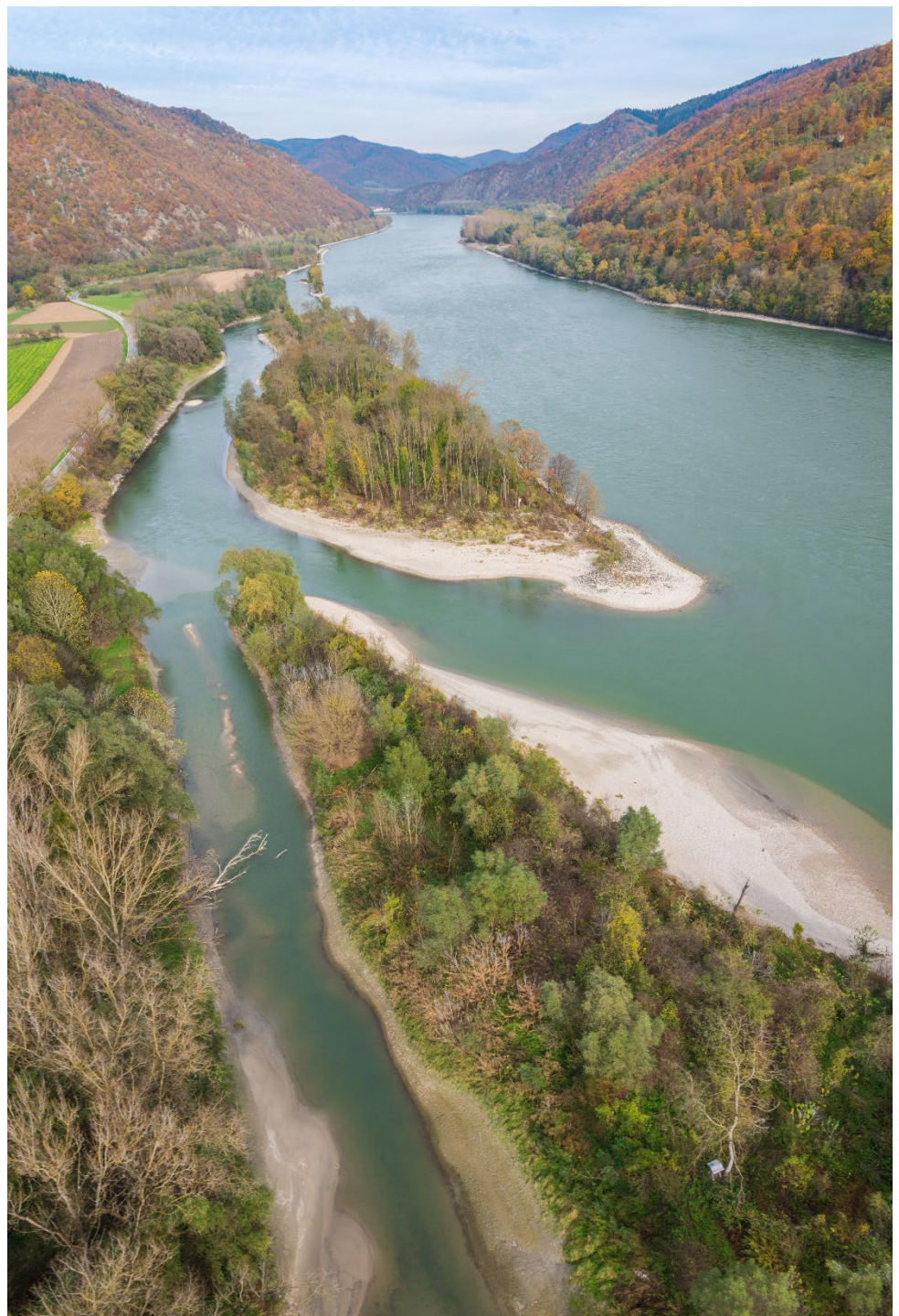
Nebenarm Grimsing- Schallemersdorf