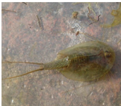
Rückenschaler Triops cancrivormis (Neuaigen 09.07.2013)