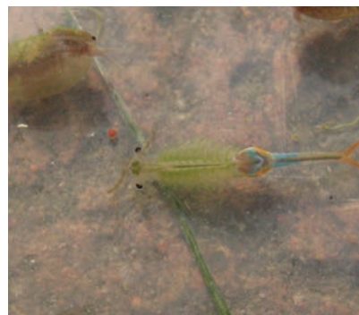
Feenkrebs Branchipus schaefferi (Neuaigen 09.07.2013)