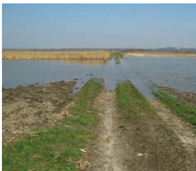
Ackersutte bei Neuaigen (02.04.2009)