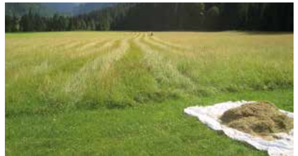
Wiesensaatgut-Gewinnung auf dem Loitzhof in Untertauern

Das Vorhaben umfasst den Aufbau einer für Salzburg gebietseigenen Wiesensaatgut-Produktion aus Wildbeständen. Mit Hilfe spezieller Geräte wird regionales Saatgut von ausgewählten Spenderflächen in Zusammenarbeit mit sechs landwirtschaftlichen Partnerbetrieben in den sechs Salzburger Herkunftsregionen gewonnen.