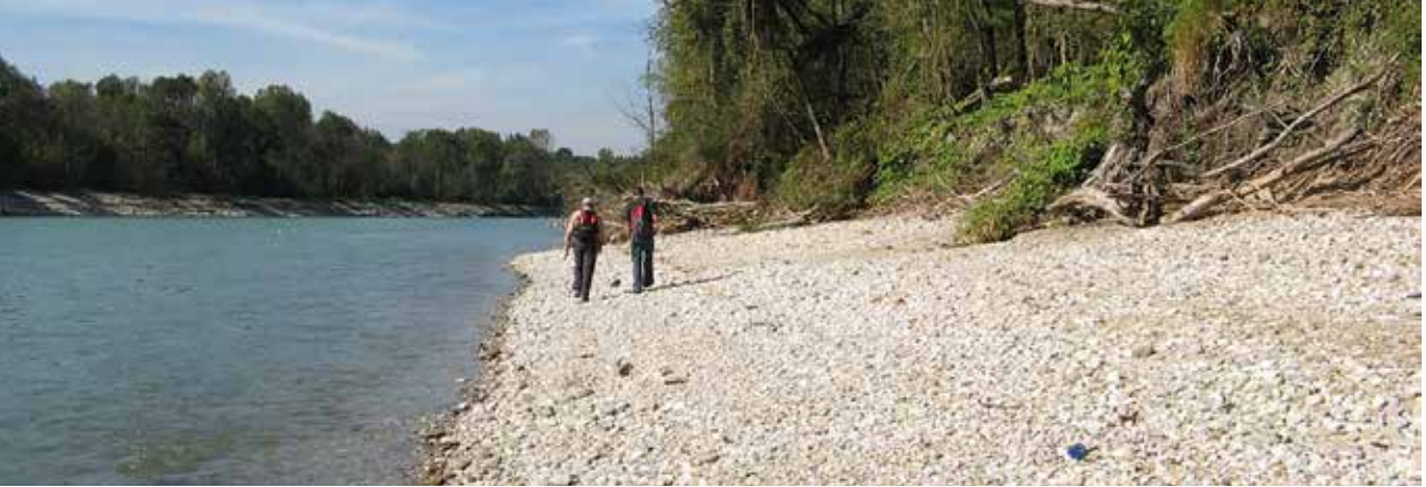
Renaturierte untere Salzach