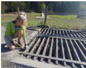
Einbau einer Kleintier-Aufstiegshilfe bei einem Weiderost

Um Amphibien das Überqueren der Straßen zu ermöglichen, werden deren Wanderstrecken im Frühjahr kontrolliert. Im Jahr 2021 wurden an 32 Abschnitten mit insgesamt 14,45 Kilometern an speziellen Schutzzäunen