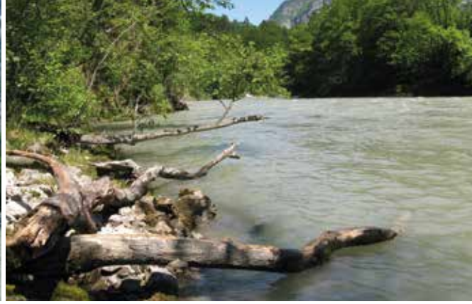
Die naturnahe Salzach bei Stegenwald