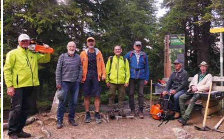
Arbeitsstrupp im Rauriser Urwald © FERİ ROBL (2)