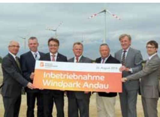
44 Energieversorgung: Windpark Andau in Betrieb genommen