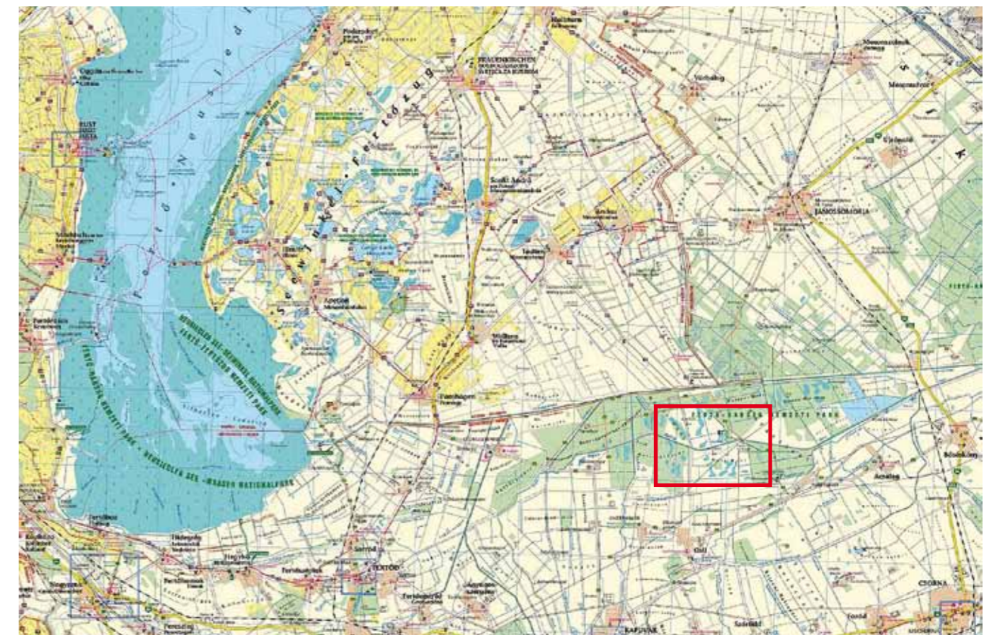
■ Im Ostteil des Nationalparks Fertő-Hanság liegt – nördlich von Osli – der Osli-Hany (rot eingrahmt)