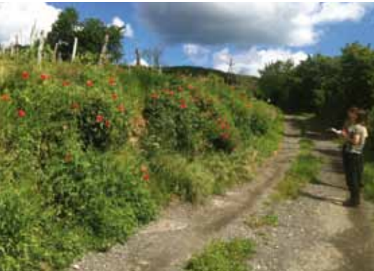
20 Sonstige Maßnahmen-Projekt Wegränder im Blickpunkt