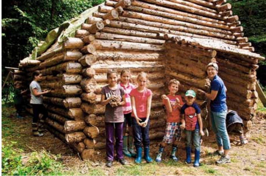
rechts: Kinder beim Isolieren einer Holzhütte im Naturpark Geschriebenstein