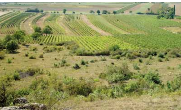
links: weitgehend unverbuschter Westabhang 2003;

Dr. Ingo KORNER Autor + Fotos AVL Arge Vegetationsökologie und Landschaftsplanung GmbH T +43 (0) 664 1840789