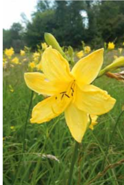
■ Gelbe Taglilie ( Hemerocallis lilioasphodelus ): Vorkommen in feuchten Wiesen, feuchten bis nassen Wäldern; Höhe: 50 – 100 cm; Blütezeit: Juni; im Burgenland stark gefährdet.

Die Schwimmblattzone der Wasserflächen ist von Jahr zu Jahr unterschiedlich ausgeprägt. Die Entwicklung der Pflanzengesellschaften hängt stark von der fischereilichen Bewirtschaftung mit Entleerung und Befüllung der Teiche und natürlich von der Witterung mit schwankendem