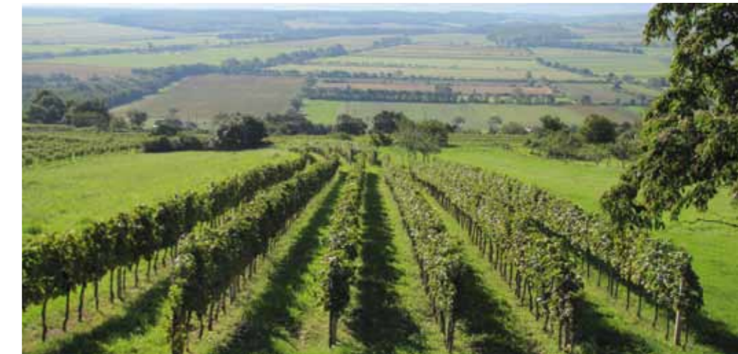
■ oben: Weinberg bei Rechnitz

Region (z. B. Erhaltung der Kulturlandschaftstypen) und den Schutz landschaftlicher Ressourcen abzielen.