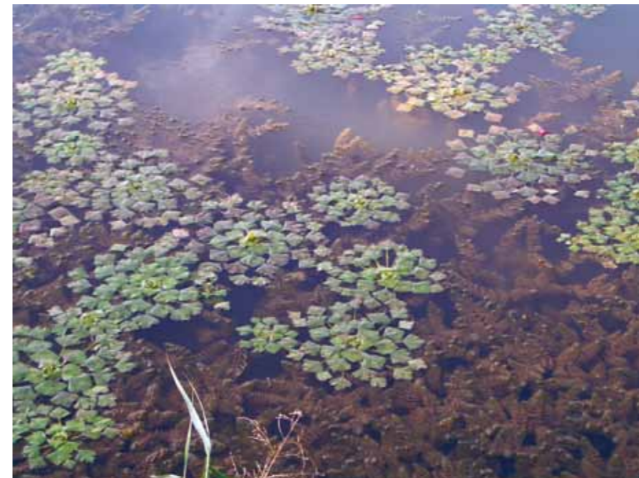
■ Wassernuss ( Trapa natans ): Vorkommen in Seebuchten, Altwässern, Teichen mit über 25 Grad Wassertemperatur; Schwimmpflanze mit essbaren Früchten; im Burgenland stark gefährdet.