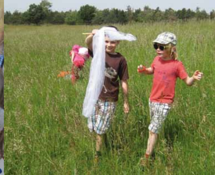
■ oben: „Falterjagd“ in Rechnitz und Ritzing rechts: Unter fachkundiger Anleitung lassen sich Falter auch berühren.