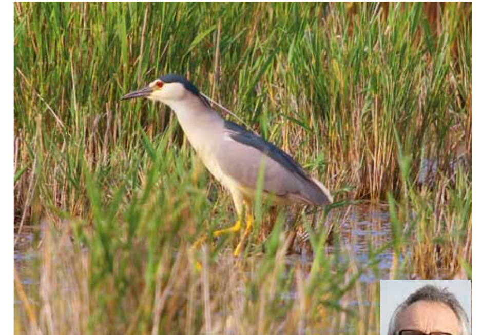
■ Rückkehrer: Der Nachtreiher

Die Erwartungen der Nationalparkdirektion an diese Lebensraumrekonstruktion hinsichtlich des Zuzugs der Tierwelt sind also voll in Erfüllung gegangen. Mit