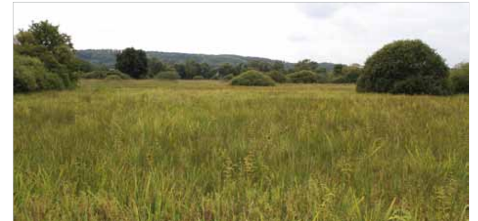
► Winkelwiesen bei Urbersdorf im unteren Stremtal

Zumindest aus westösterreichischer Perspektive scheint es erstaunlich, dass das Burgenland auch ausgedehnte Waldlandschaften beherbergt. Unter diesen finden sich durchaus auch solche mit naturnahen Waldökosystemen, beispielsweise in der Hügellstufe des Leithagebirges und des Marzer Kogels oder der Landseer Berge, wo sich hervorragende Beispiele für wärmegetönte Eichen- und Eichen-Hainbuchenwälder finden. Auch das Bernsteiner und Günser Gebirge sind waldgeprägt und beherbergen arten- und strukturreiche Laubwälder, darunter schöne Beispiele für Rotbuchenwälder der Bergstufe sowie Serpentin-Föhrenwälder als