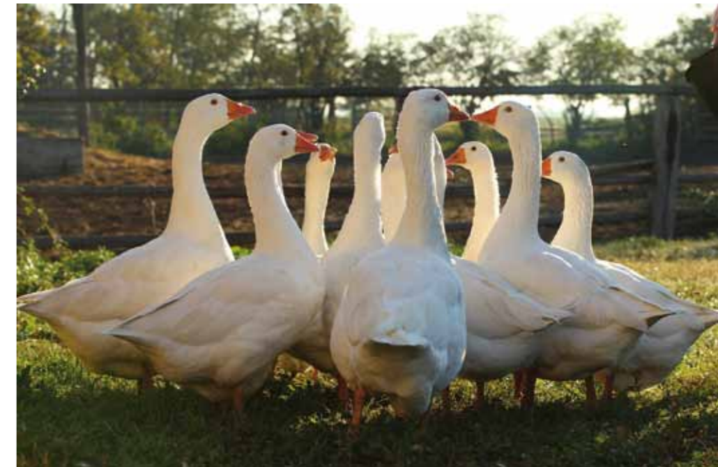
■ Slow Food Burgenland schafft mit zwei Veranstaltungen am 11. und 12. Oktober in Rust die Verbindung zwischen den Aktionstagen Nachhaltigkeit und der touristisch-kulinarischen Veranstaltung „Gans Burgenland 2014“.

Getragen werden die Aktionstage von den Nachhaltigkeitskoordinatorinnen und -koordinatoren aller Bundesländer sowie dem Ministerium für ein lebenswertes Österreich. Auch im Burgenland sind bereits verschiedenste Aktionen in Planung, wie zum Beispiel: ► Ideen- und Projektwettbewerb für Schulen zum Thema „Nachhaltigkeit macht Schule – welchen Beitrag leistest DU?“ ► Kostenlose Energieberatung der Bgld. Energieagentur