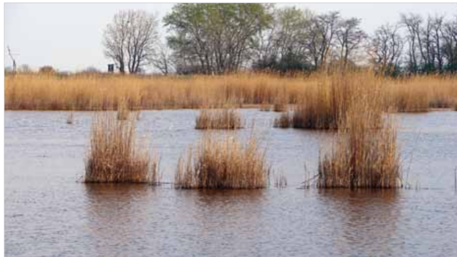
■ oben + unten: Schilfaufwuchs und Schlammflächen bilden den Lebensraum für benthische Wirbellose.

Eine bemerkenswerte erste Erkenntnis der bisherigen Untersuchungen ist der Umstand, dass es im Schilfgürtel große Unterschiede in der Besiedlungsdichte durch Wirbellose gibt. Manche Flächen sind für nahrungssuchende Fische somit sehr attraktiv, andere hingegen haben nur sehr wenig zu bieten. Ausschlaggebende Faktoren sind die Textur des Sediments und verschiedene