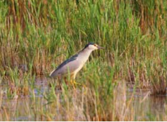
12 Nachtreiher in renaturiertem Hanság-Gebiet Osli-Hany