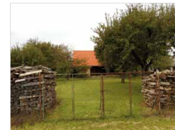
■ Typischer Hintaus-Streuobstgarten (Güttenbach)

DI Christian HOLLER Autor und Projektleiter c.holler@tb-holler.at T +43 (0)664 4773149