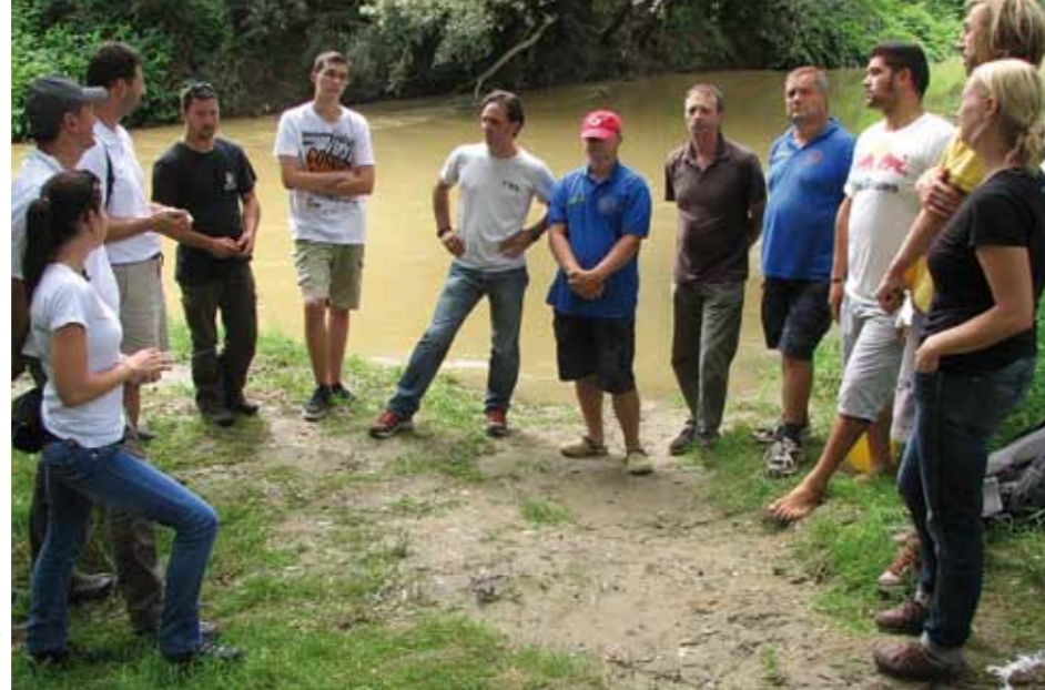
rechts: Kanuguides beim Weiterbildungsworkshop im Naturpark Raab