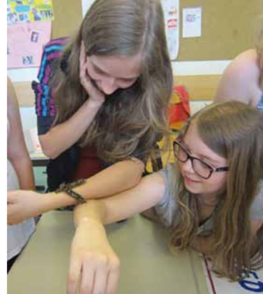
■ oben: „Ich will auch ein Puppenhaus, Frau Lehrer!“ links: Mit den Bestimmungstabern ist ein rasches Erfolgserlebnis möglich.