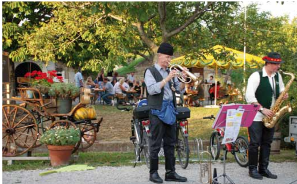
■ Spätsommerliches Fest im Naturpark

Ein Projekt ist der Erhaltung landwirtschaftlichen Kulturguts durch „Fünf Kirschsorgengärten“ in der Region Neusiedler See – Leithagebirge gewidmet. Die Kirschsorgengärten entstanden in den fünf Naturparkgemeinden durch ein wissenschaftliches Projekt, das in den Jahren 2012 und 2013 an der Abteilung Wein- und Obstbau der Universität für Bodenkultur in Wien durchgeführt