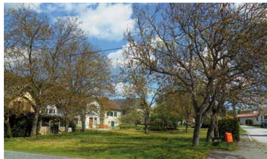
■ links: Nussbäume im Ort (Eisenberg a.d. Pinka)

Eine grobe Abschätzung der vorhandenen Bestände wurde 1999 im Rahmen eines Gutachtens über das Pressobstaufkommen im Burgenland vorgenommen (Holler & Reiterer 1999).