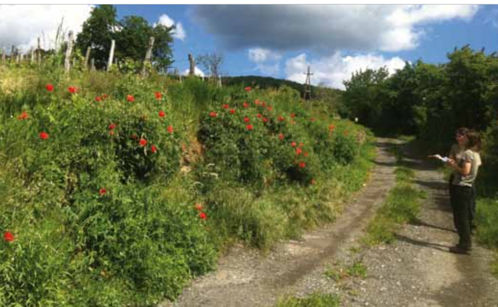
■ Blühende Böschung im Weingebirge bei Rechnitz