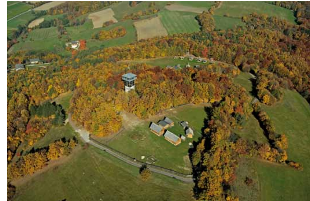
■ Aus der Vogelperspektive: Das Keltische Freilichtmuseum Schwarzenbach mit dem Museumsturm, von dem aus man einen fantastischen Rundblick auf die Region genießen kann.

Abgesehen vom Erlebnisfaktor muss eine Wanderung auch bewältigbar sein. Es eignen sich daher Wege, die einfach und ungefährlich zu begehen sind. Auch sollte die Wanderung nicht zu anstrengend werden, eine Tour über einige Hundert Höhenmeter ist auf jeden Fall zu viel. Planen Sie mit Kindern etwa das Eineinhalbfache