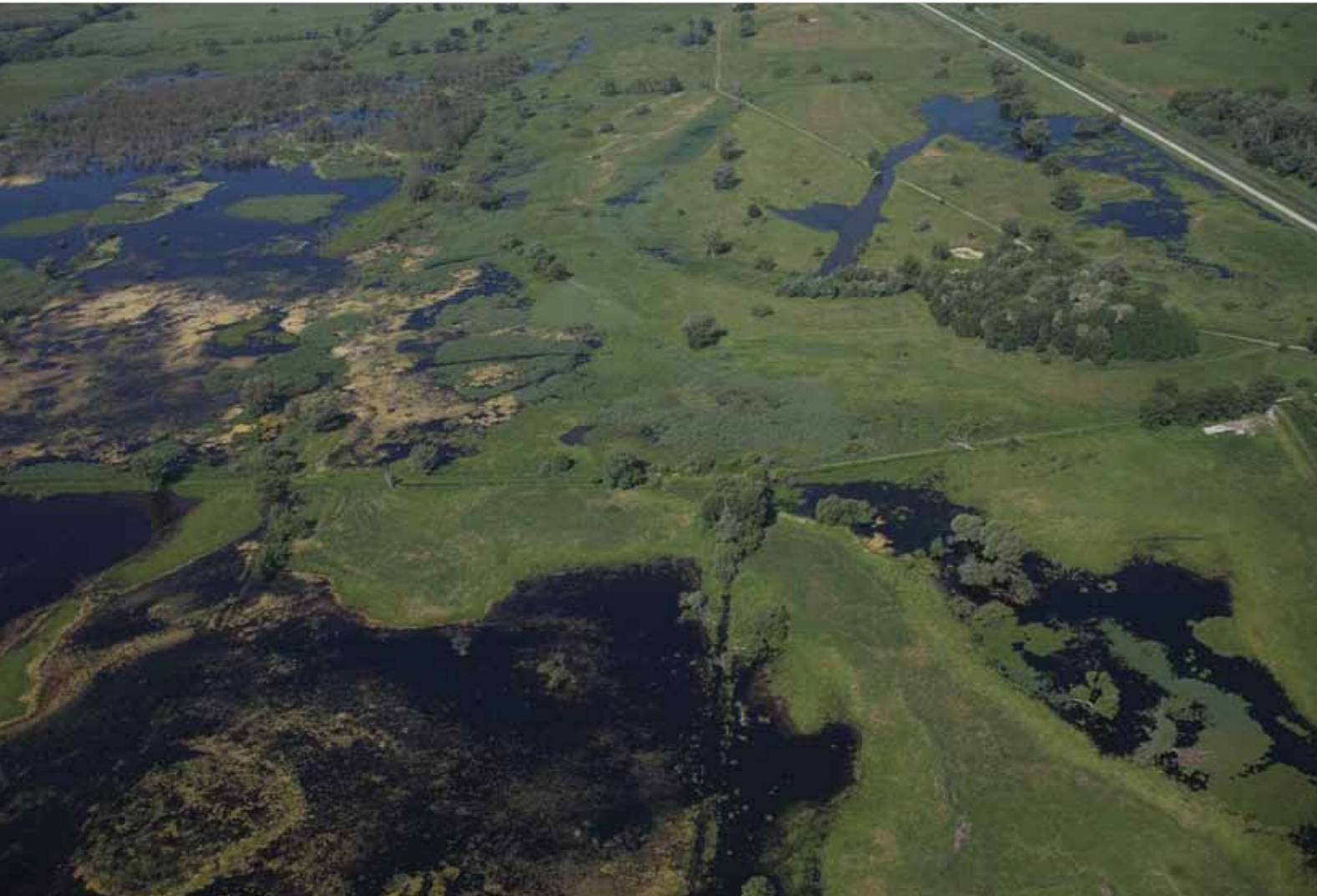
■ Die Flugaufnahme des Osli-Hany im Osten des Nationalparks Fertő-Hanság zeigt ein vielfältiges und wertvolles Mosaik an Lebensräumen.

großer Wahrscheinlichkeit wird es im Osli-Hany bald auch zu einer Rückkehr seltener Pflanzenarten kommen.