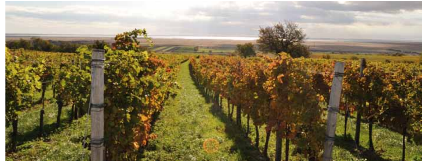
■ Die Pannonische Tiefebene als Beispiel einer wertvollen ästhetischen Kulturlandschaft