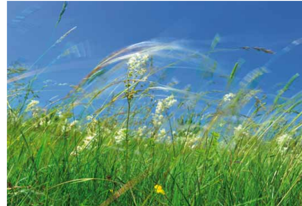
Attraktive Vegetation auf Magerstandorten: Das Federgras

Doch die Entbuschung und Wiederherstellung dieser Standorte ist das Eine, deren Erhaltung das Andere. Während Ersteres in einer einmaligen Aktion erledigt werden kann, bedarf Zweiteres einer laufenden Pflege, um eine neuerliche Verbuschung zu verhindern. Externe Förderprogramme, wie beispielsweise ÖPUL-Maßnahmen, sind hier zwar sehr hilfreich, können jedoch, speziell auf sehr unebenen und steilen Flächen, die laufende Pflege nicht zur Gänze finanziell abdecken. Zudem gelten einige dieser naturschutzfachlich hochwertigen Flächen nicht als landwirtschaftliche Nutzflächen und sind somit nicht förderbar. Die Folge ist, dass diese Standorte wieder verbus-