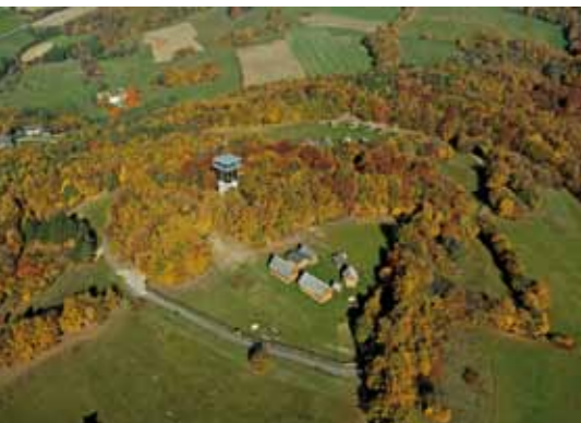
33 Naturpark Landseer Berge: Tipps für's Wandern mit Kindern