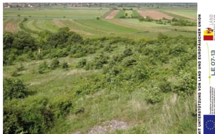
rechts: stark verbuschter Westabhang 2013