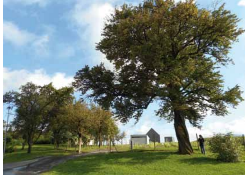
■ li.: Streuobstbestände um die Kellerstöckl (Moschendorf); re.: Mächtiger Mostbirnbaum (D. Tschantschendorf)