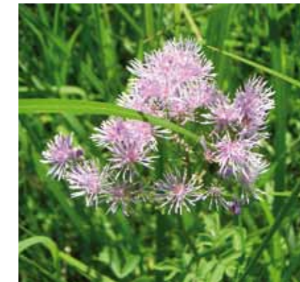
■ Akelei-Wiesenraute ( Thalictrum aquilegifolium ): Vorkommen in frischen bis feuchten Edellaubwäldern, Säumen und Hochstauden-fluren; Höhe: 40 – 120 cm; Blütezeit: Mai bis Juli; im Burgenland gefährdet.

Aus botanischer Sicht ist das Vorkommen der Wassernuss ( Trapa natans ) besonders erwähnenswert. Weiters sind im Gebiet Pflanzenarten der burgenländischen Roten Liste wie Europa-