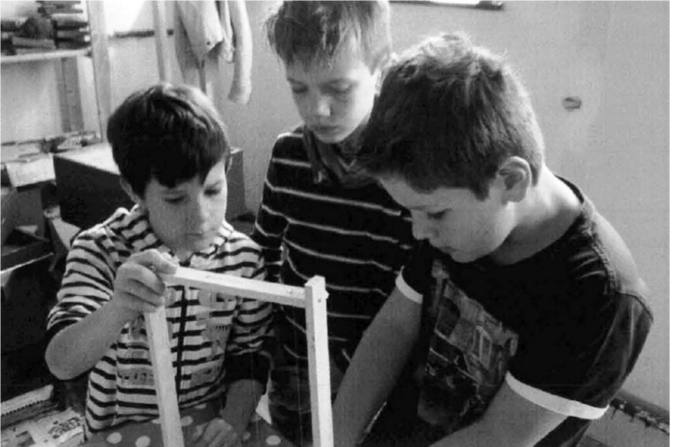
_ VS Uttendorf