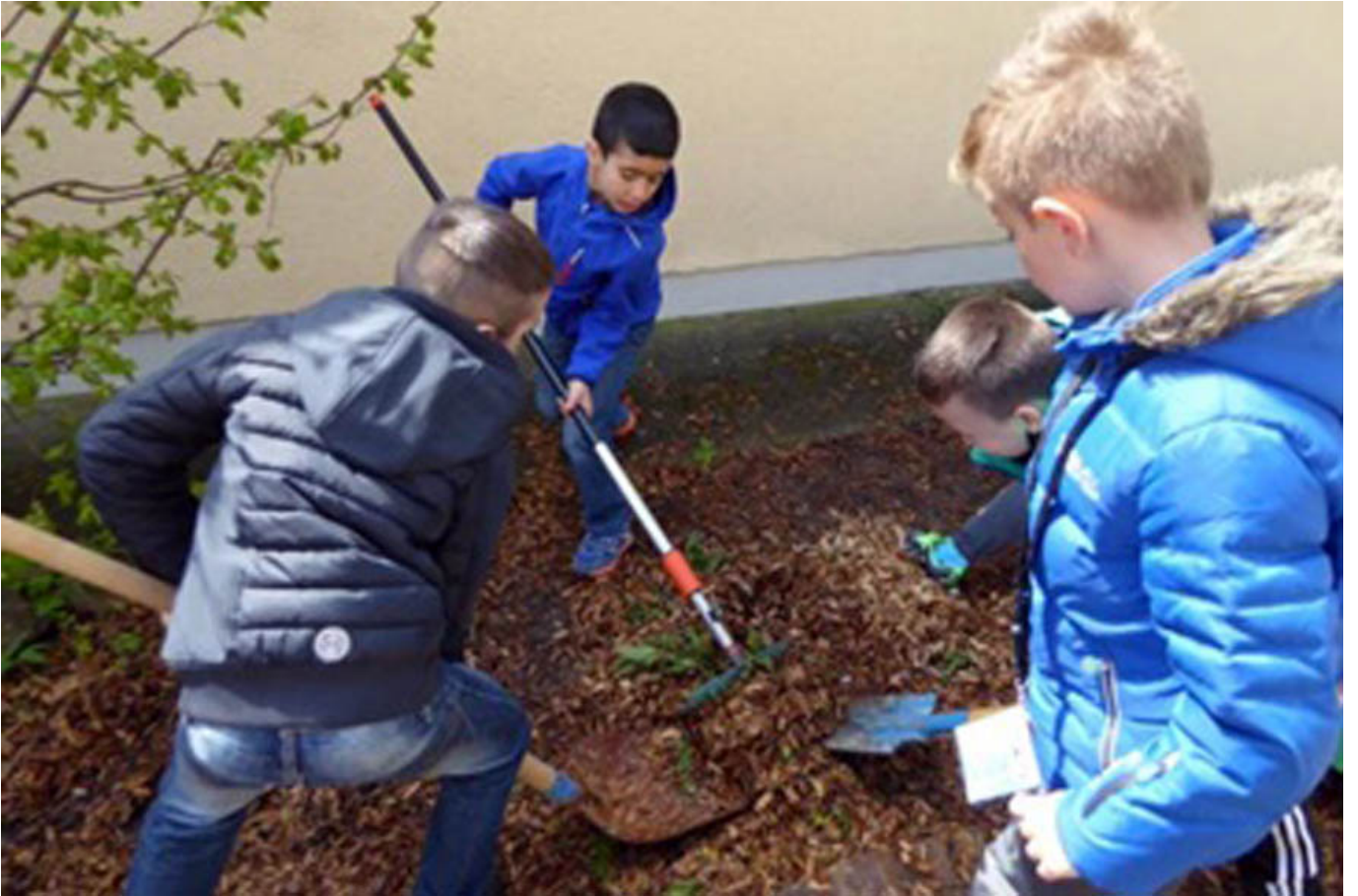
_ VS Lichtenegg