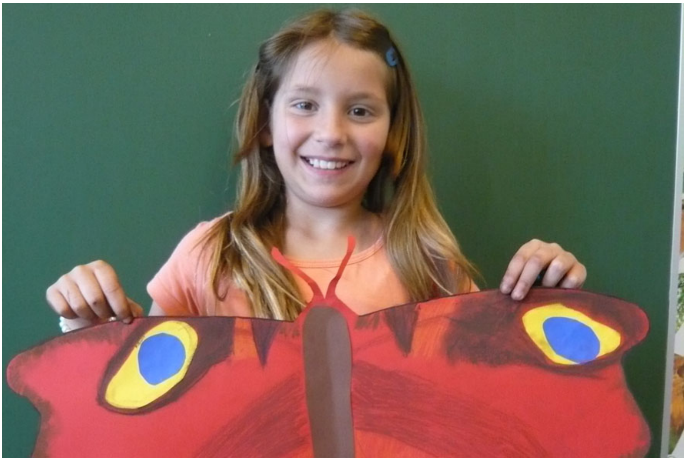
_ VS Wundschuh