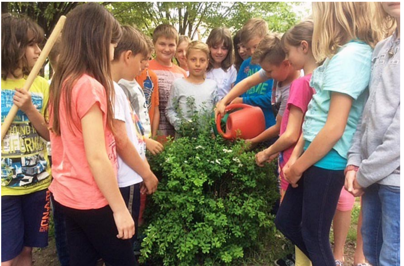
_ VS Zemendorf