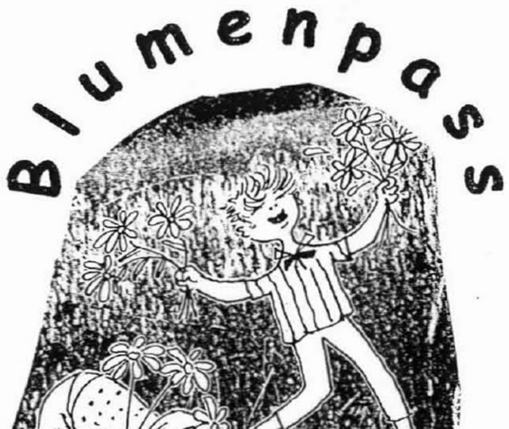
_ VS Vorchdorf