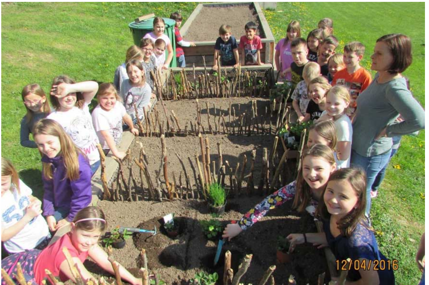
_ VS Ehrenhausen