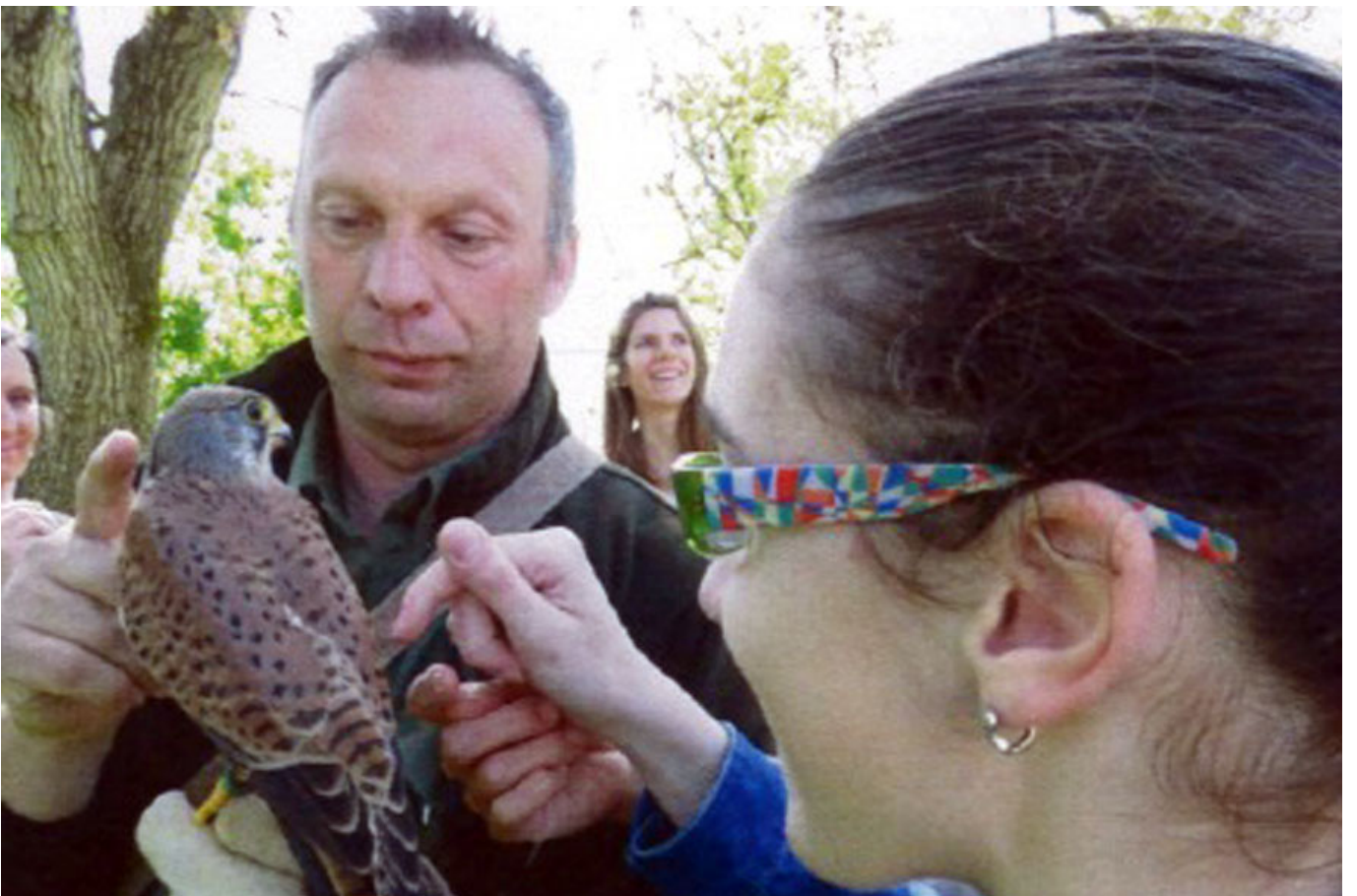
_ VS Dr. Schärfschule