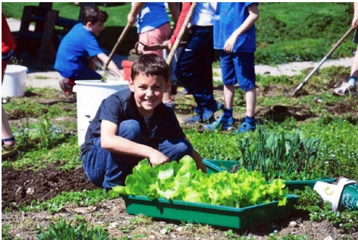
_ VS Bezaü