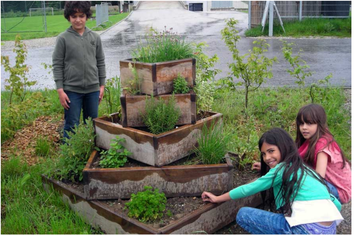
_ VS St. Pantaleon