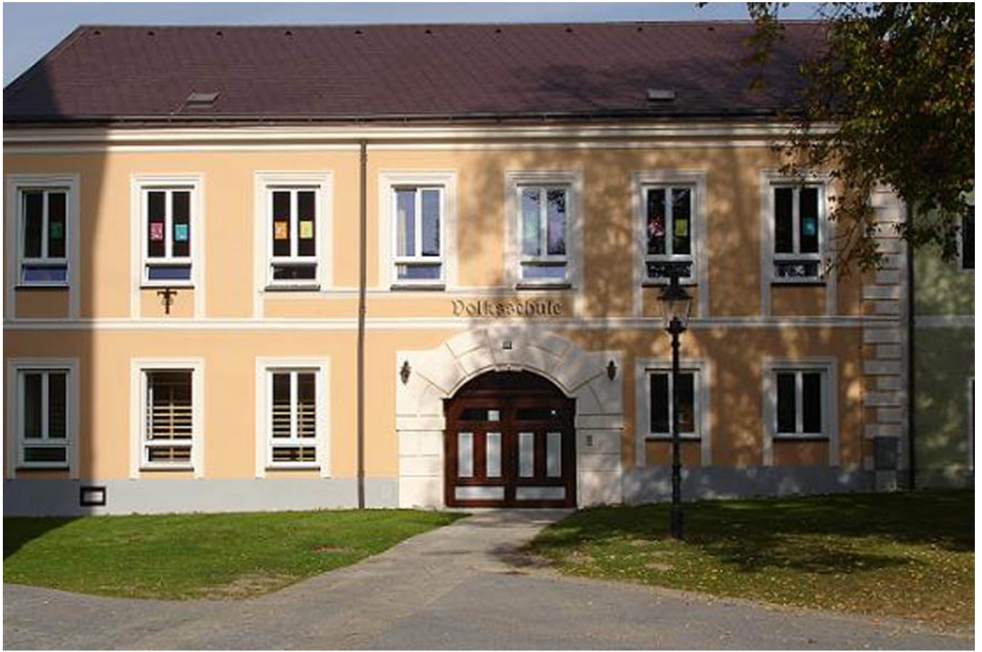
_ VS Hirschbach