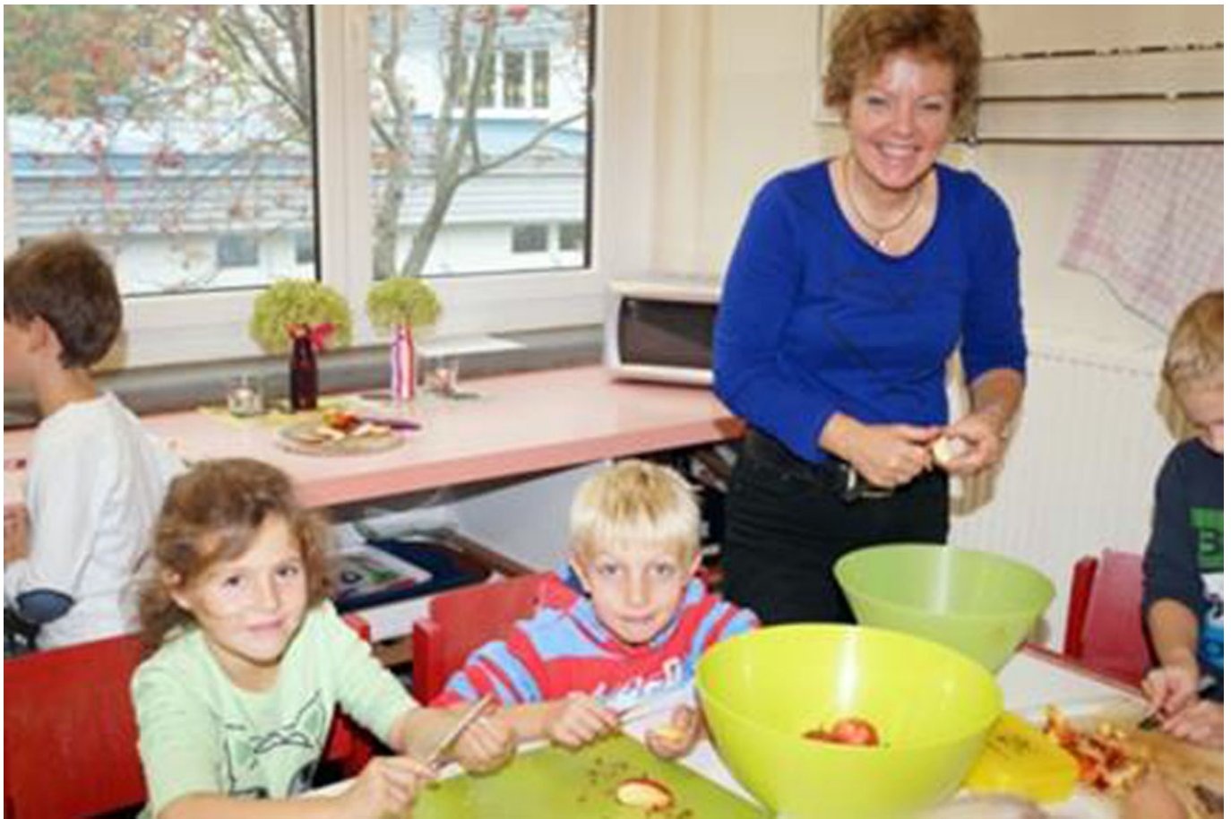
_ VS St. Ulrich bei Steyer