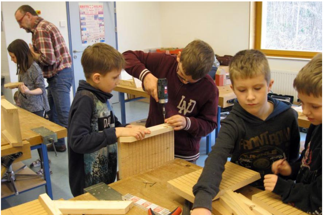
_ VS Wildon