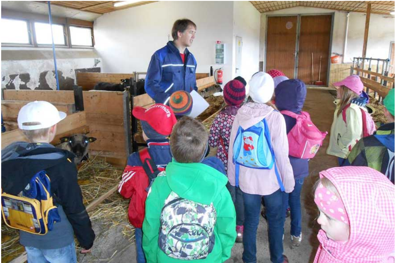
_ VS Wenigzell