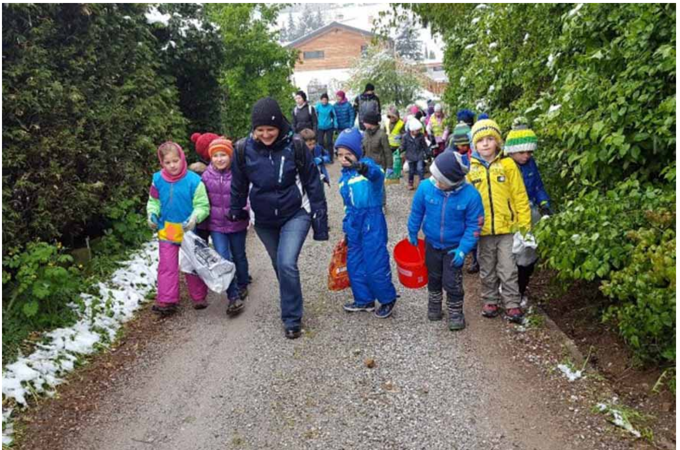
_ VS Thal