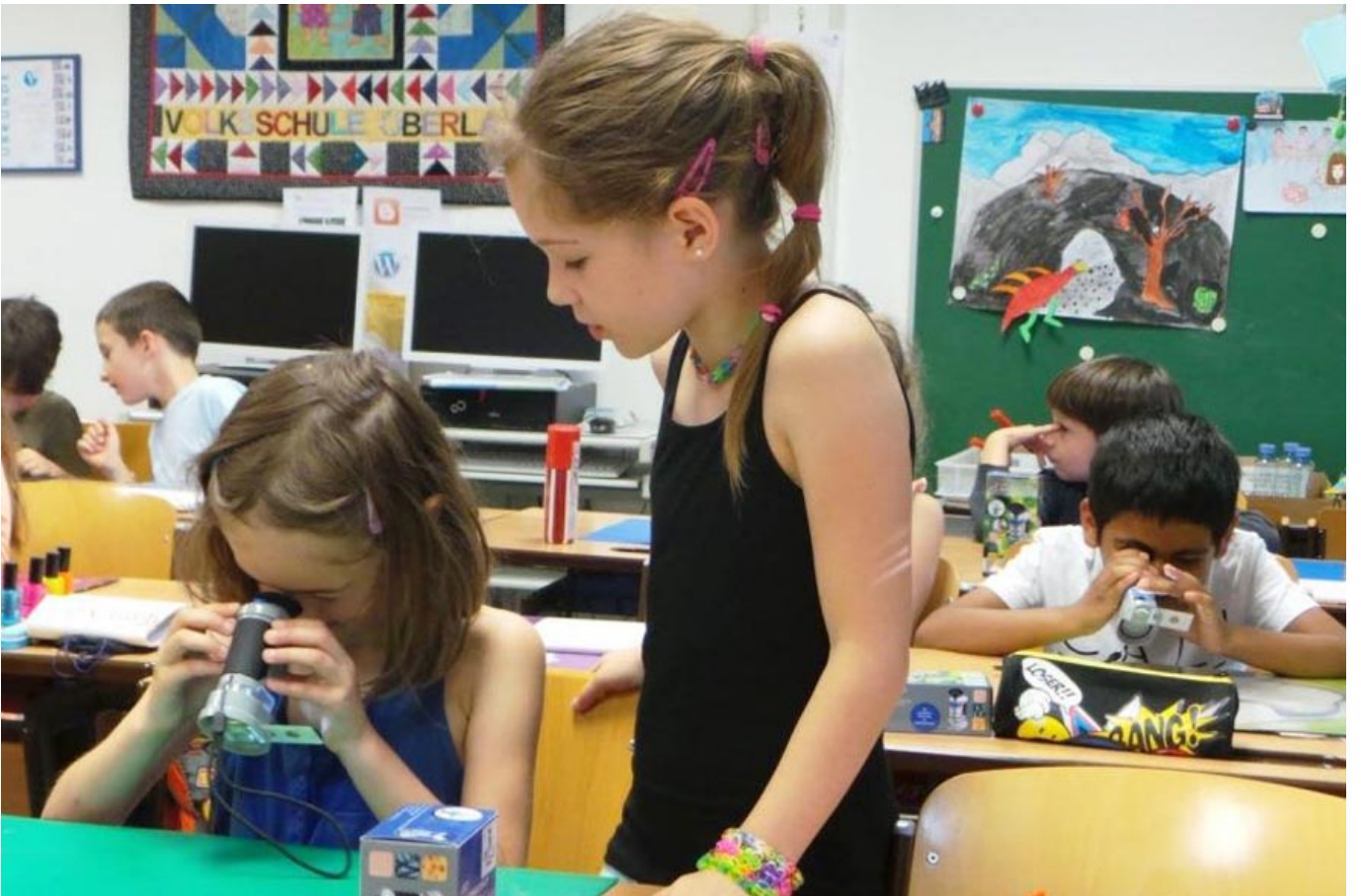
_ VS Oberlaa