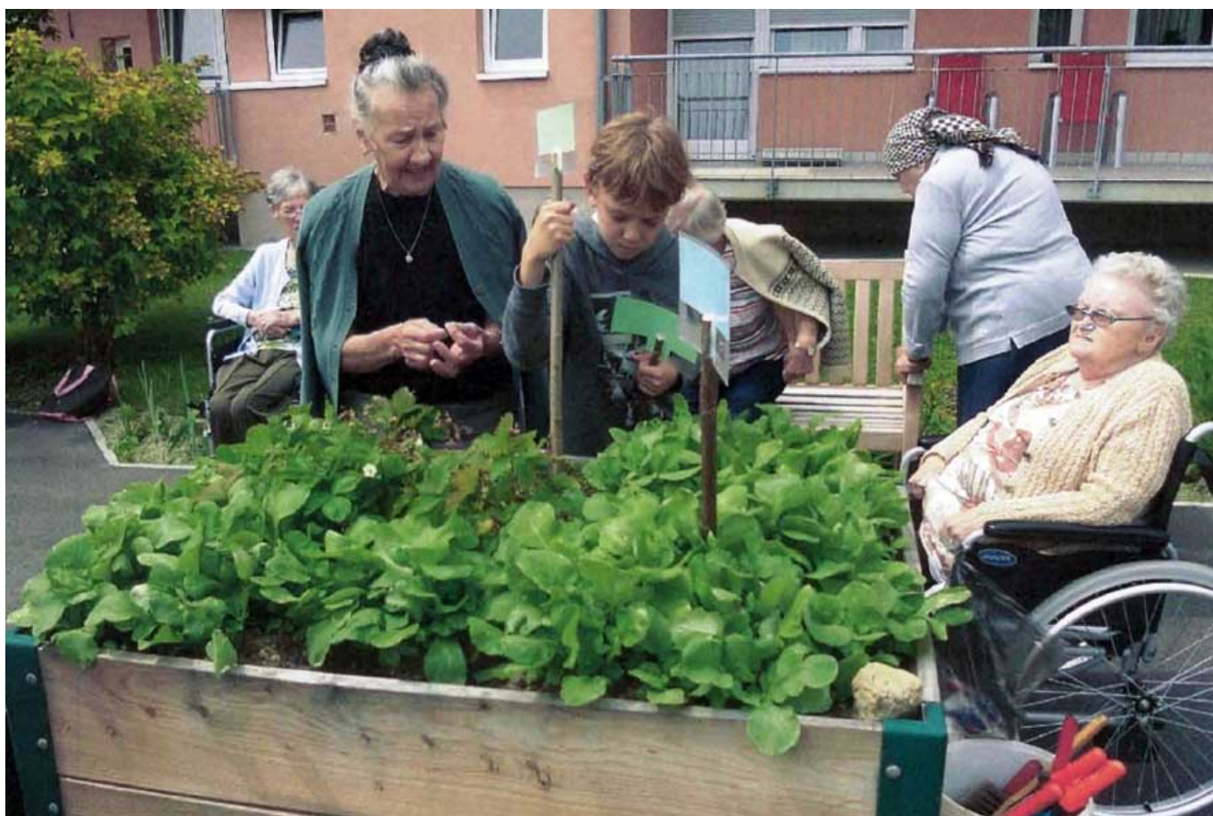
_ VS Eisbach-Rein

Gesamt wurden 83 Projekte beim vielfalt leben Gemeinde-Champion Wettbewerb eingereicht. Volksschulen aus ganz Österreich haben sich beteiligt. Wir möchten uns ganz herzlich für das Engagement bedanken und alle Projekte nach Einreichdatum sortiert, vorstellen. Durch einen Klick auf das Foto finden Sie die Beschreibung des eingereichten Projekts.