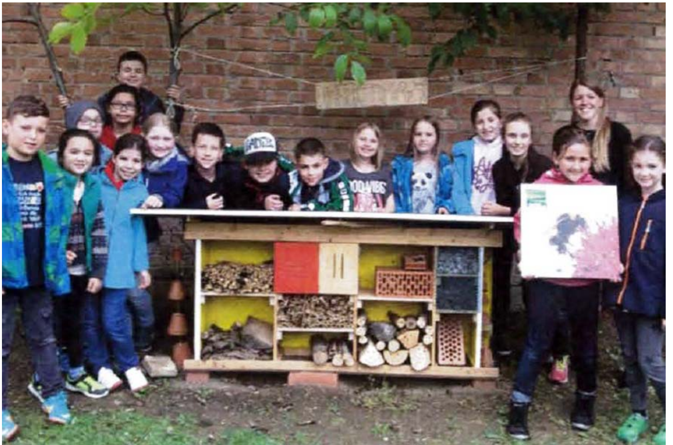
_ VS Fischamend