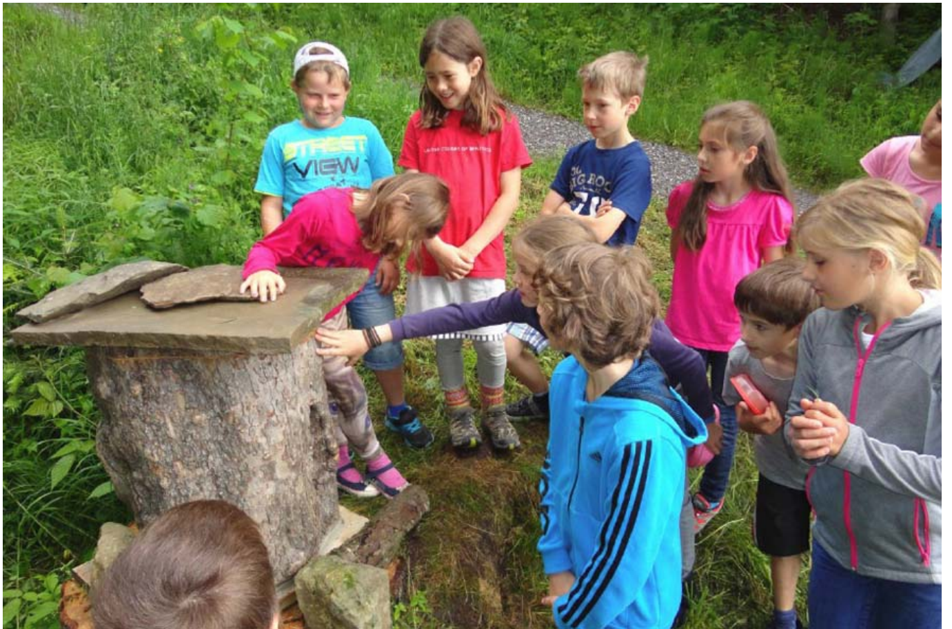
_ VS Doren