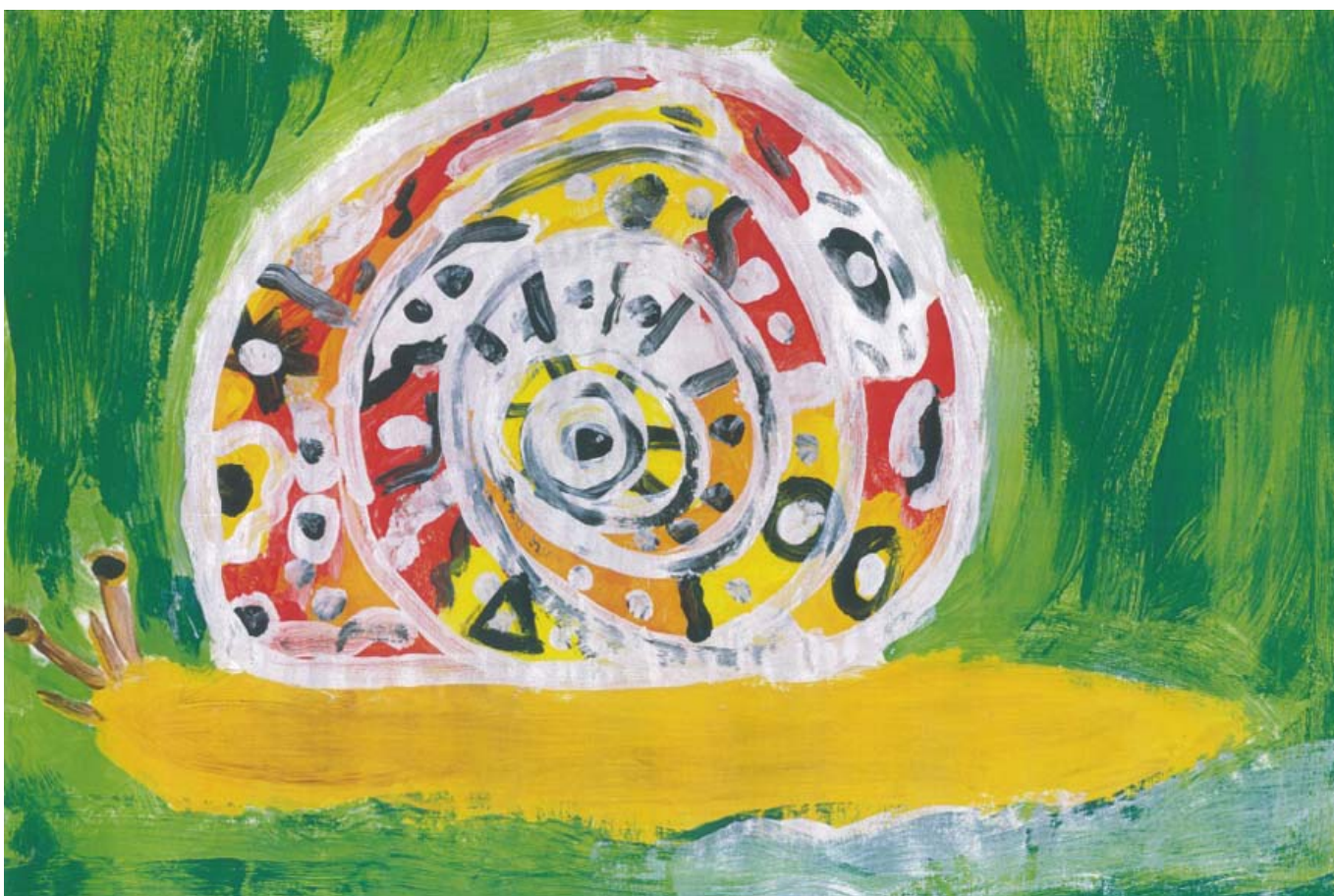
_ VS St. Ulrich im Greith