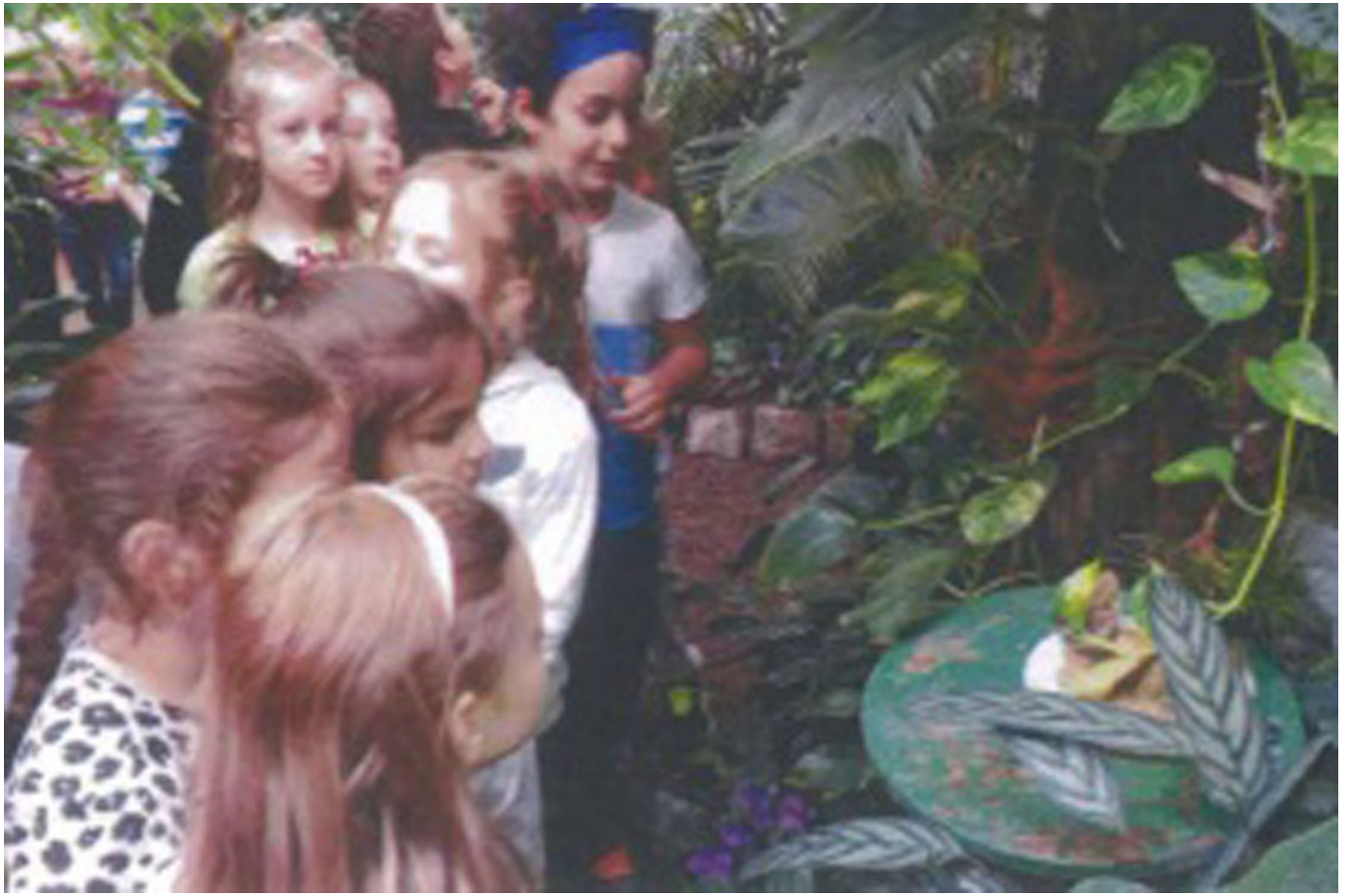
_ VS Südstadt