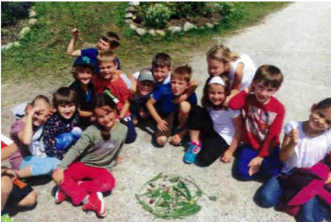
_ VS Itter