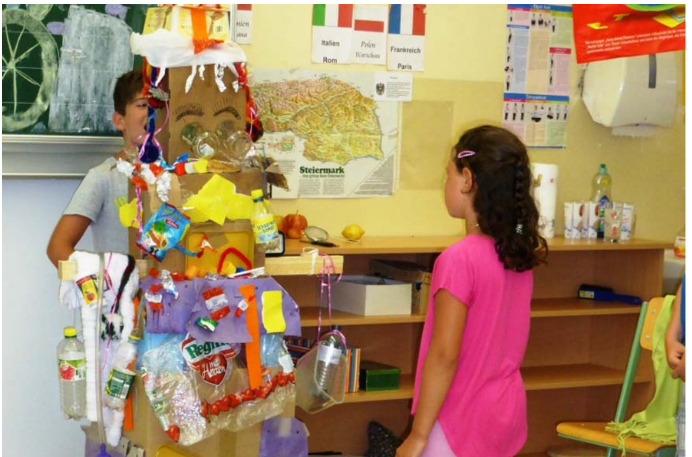
_ VS Leoben Stadt