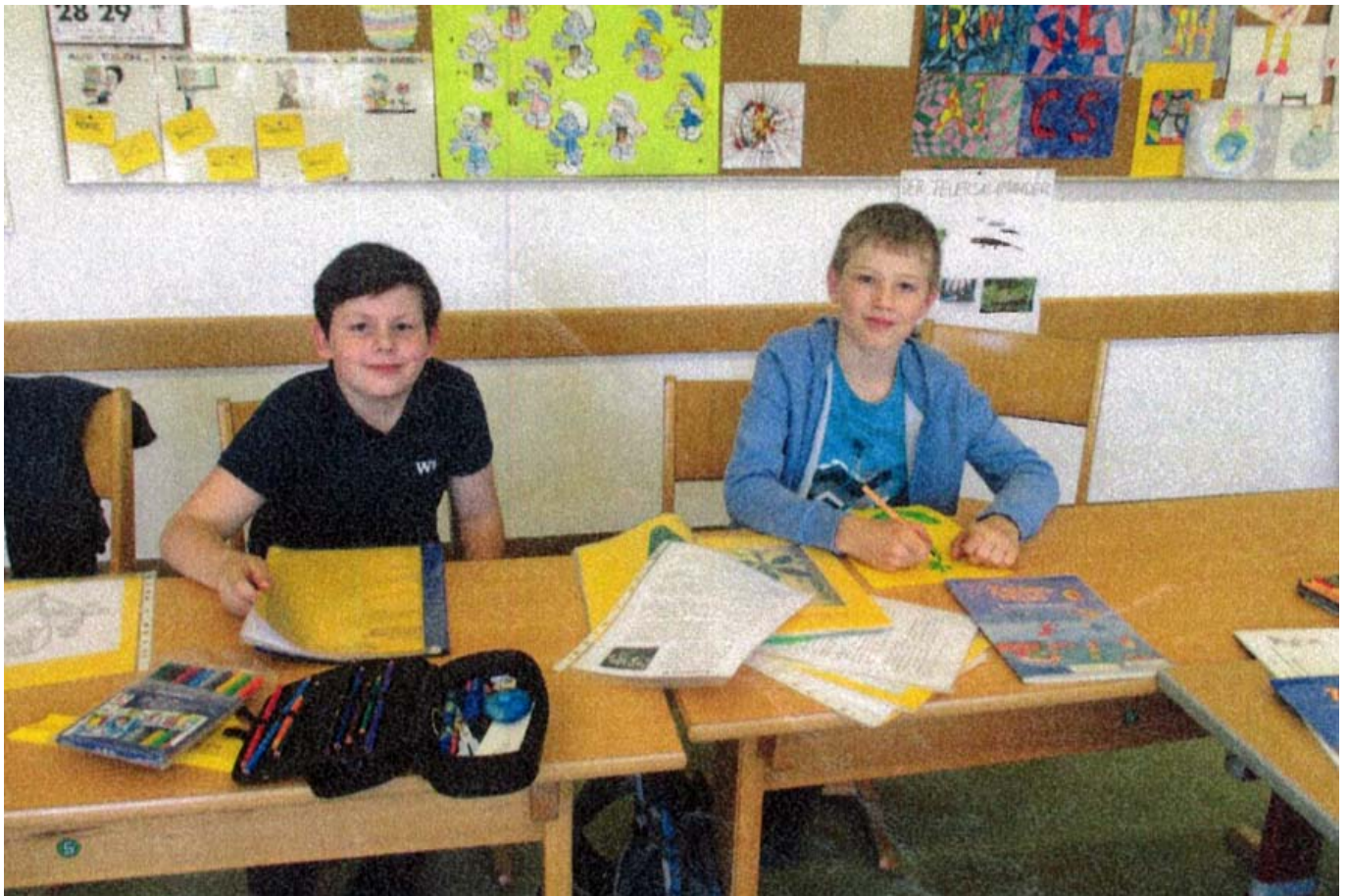
_ VS Aurach "Natur des Jahres"