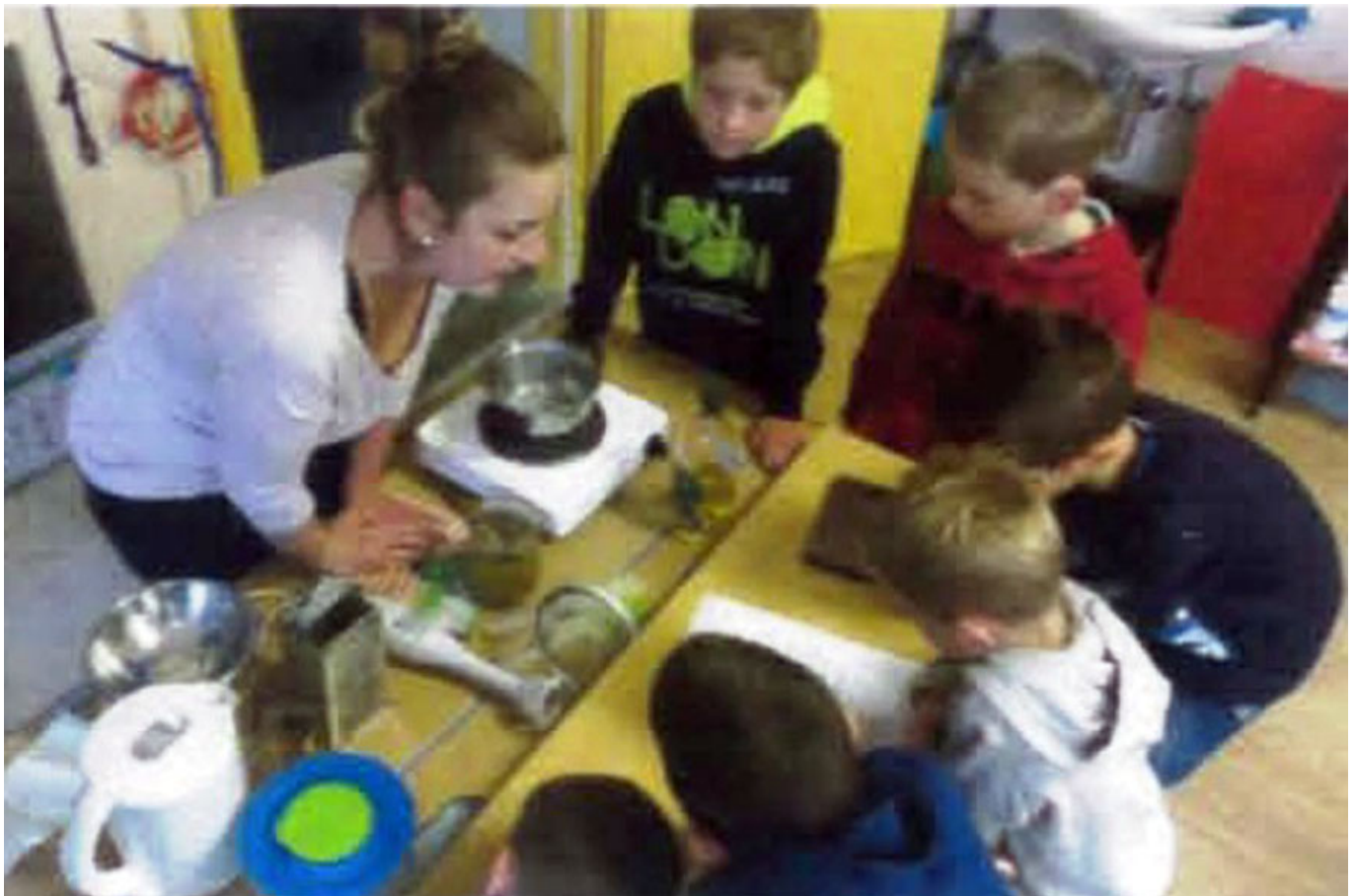
_ VS Oberweißburg