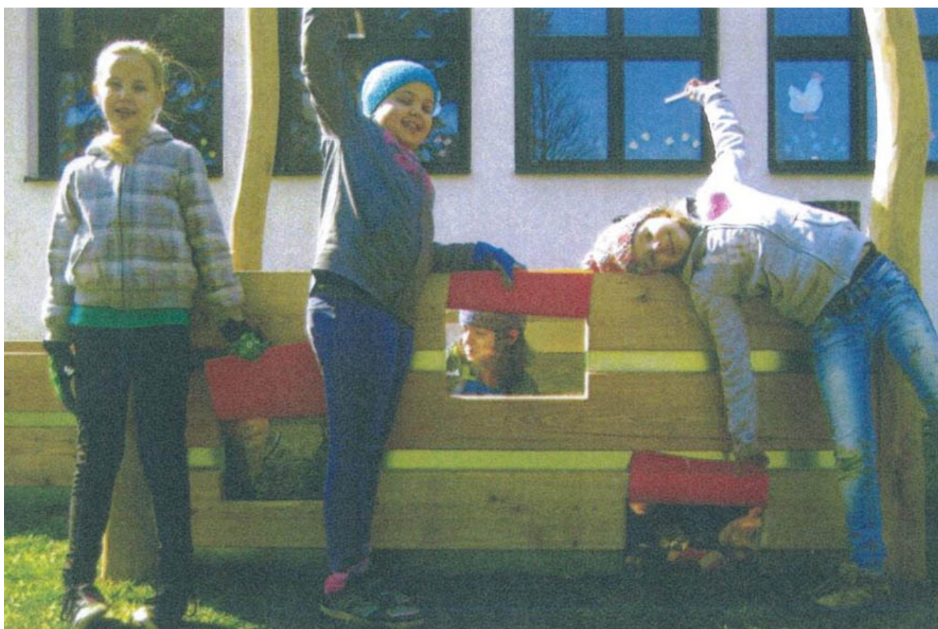
_ VS Weiden bei Rechnitz