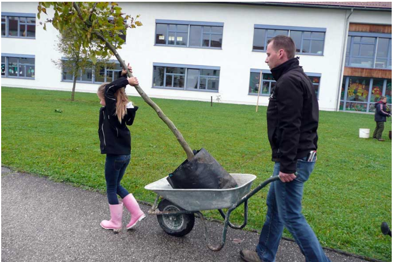
_ VS Schlüßlberg