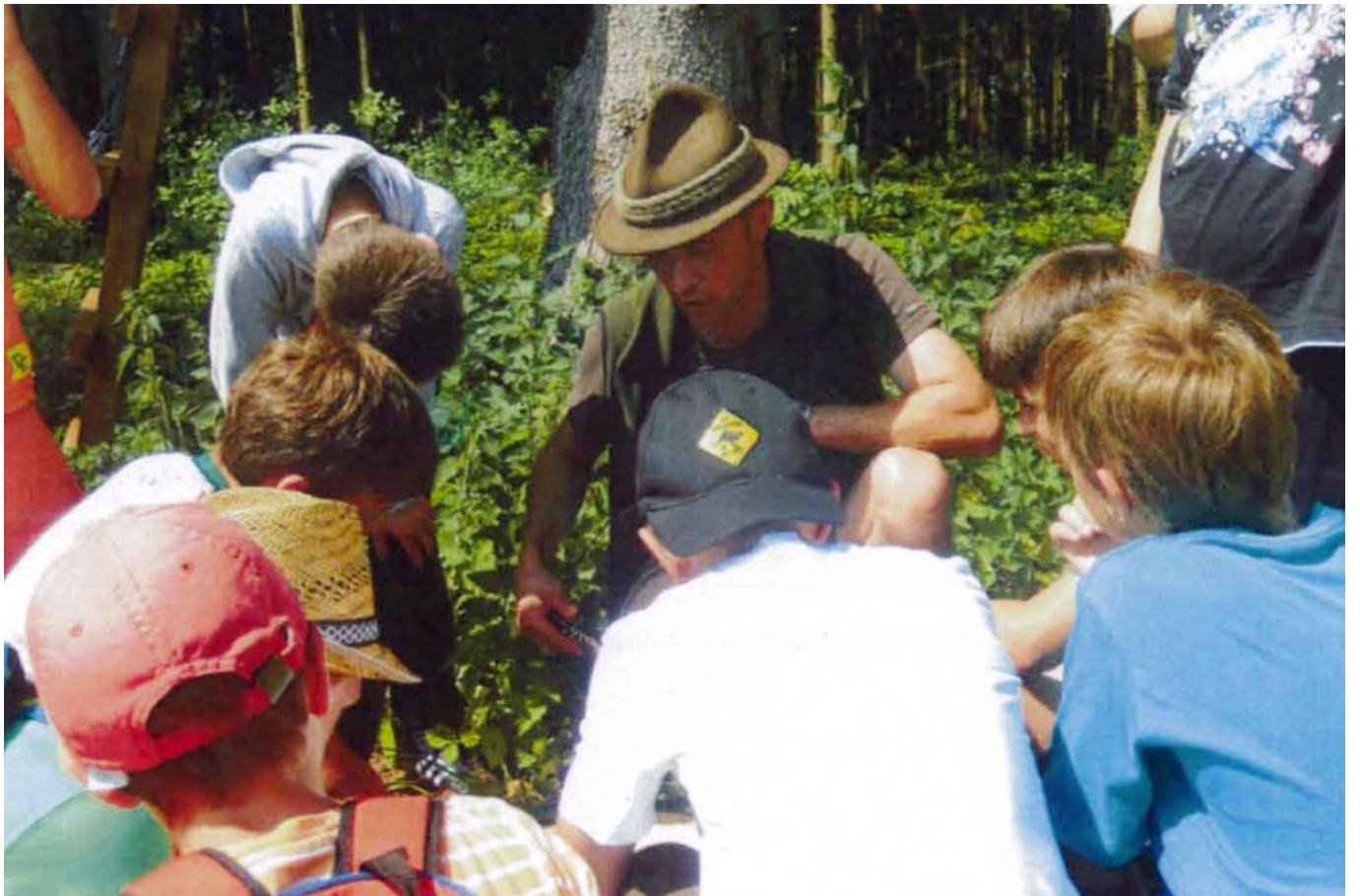
_ VS Kirchham