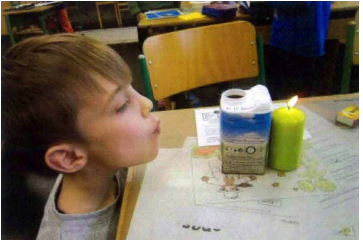
_ VS Schiltern