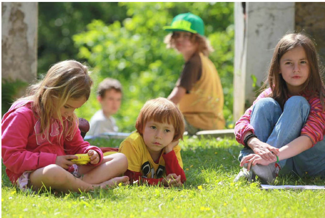
_ PS Graz