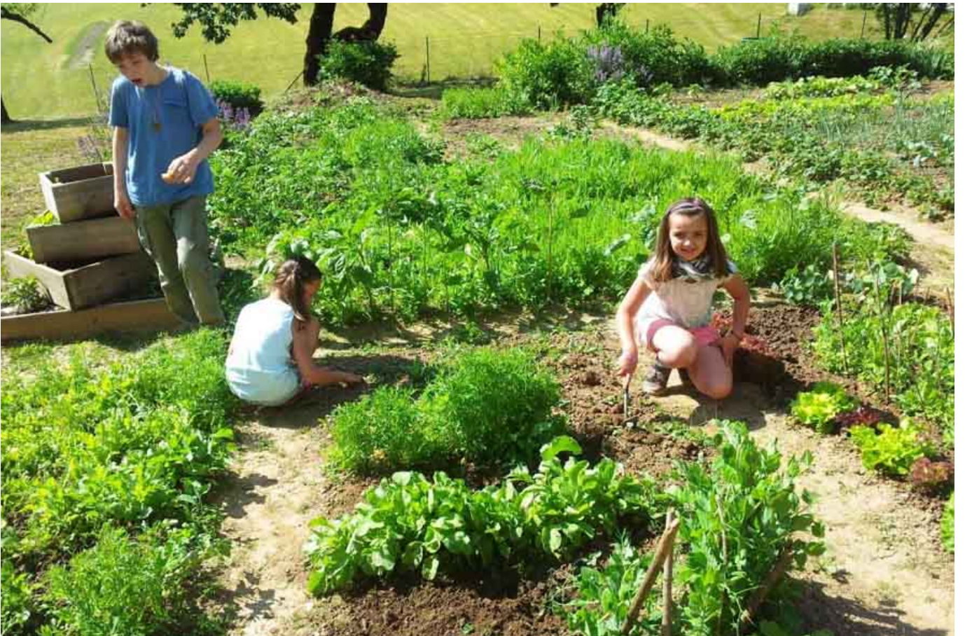
_ VS Expositur Pisweg