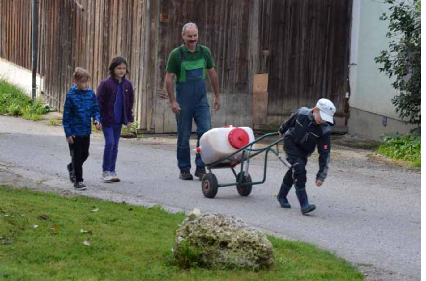
_ VS Pamet