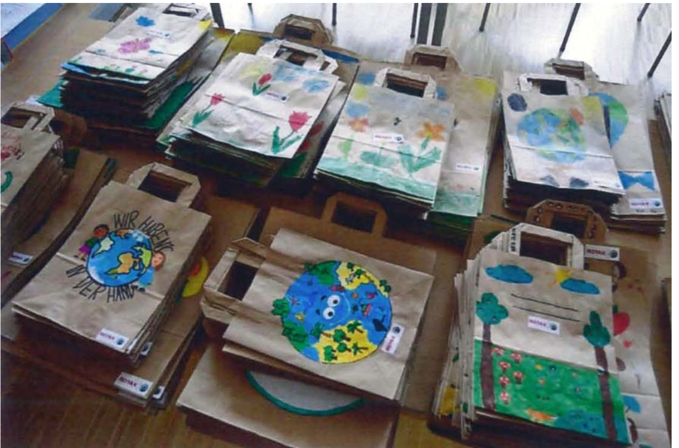
_ VS Gunskirchen