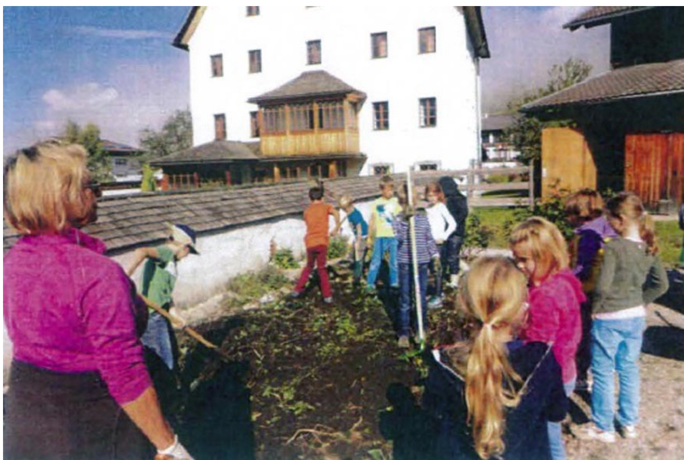
_ VS Maria Alm