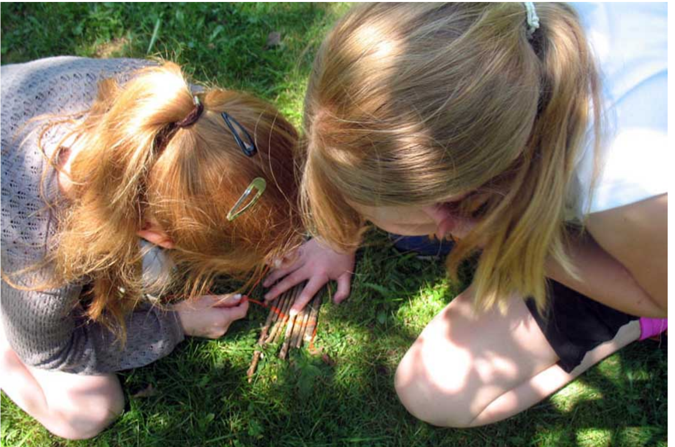
_ VS St. Marein bei Neumarkt