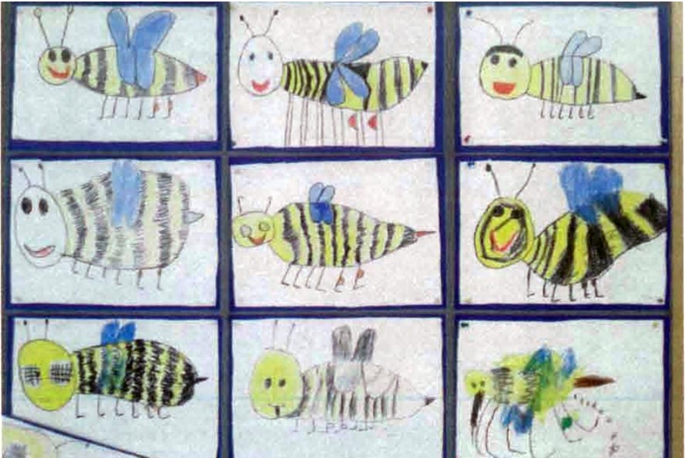
_ VS Tarsdorf