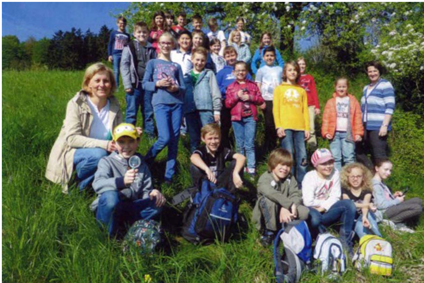
_ VS St. Pölten St. Georgen