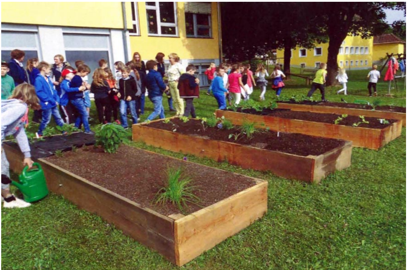
_ VS St. Margarethen ob Töllerberg