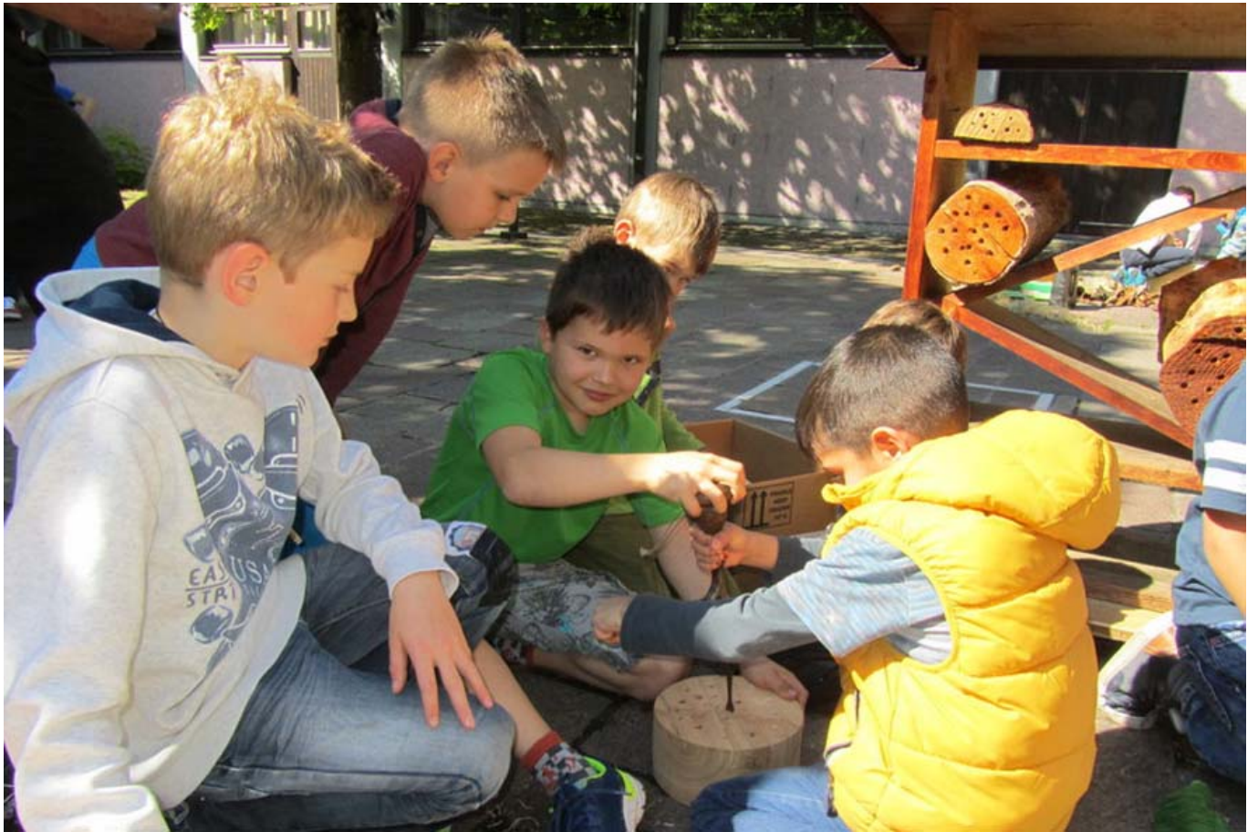
_ VS Vandans