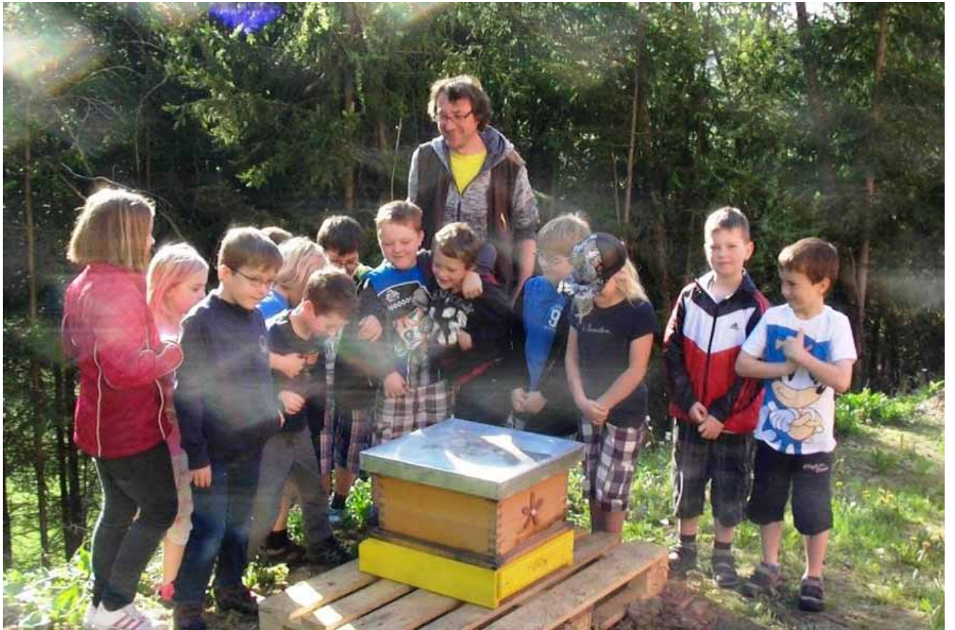
_ VS St. Marein bei Graz