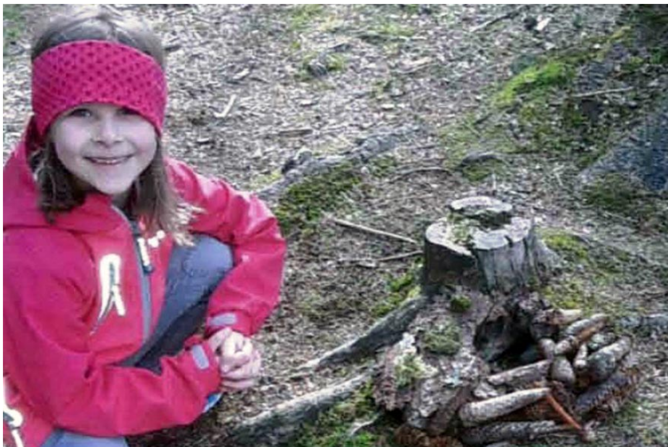
_ VS Kirchberg