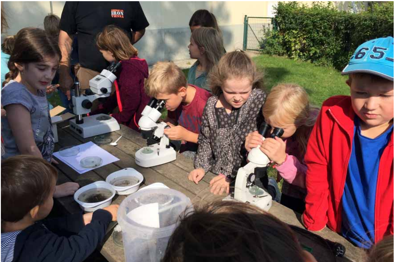
_ VS Maria Enzersdorf