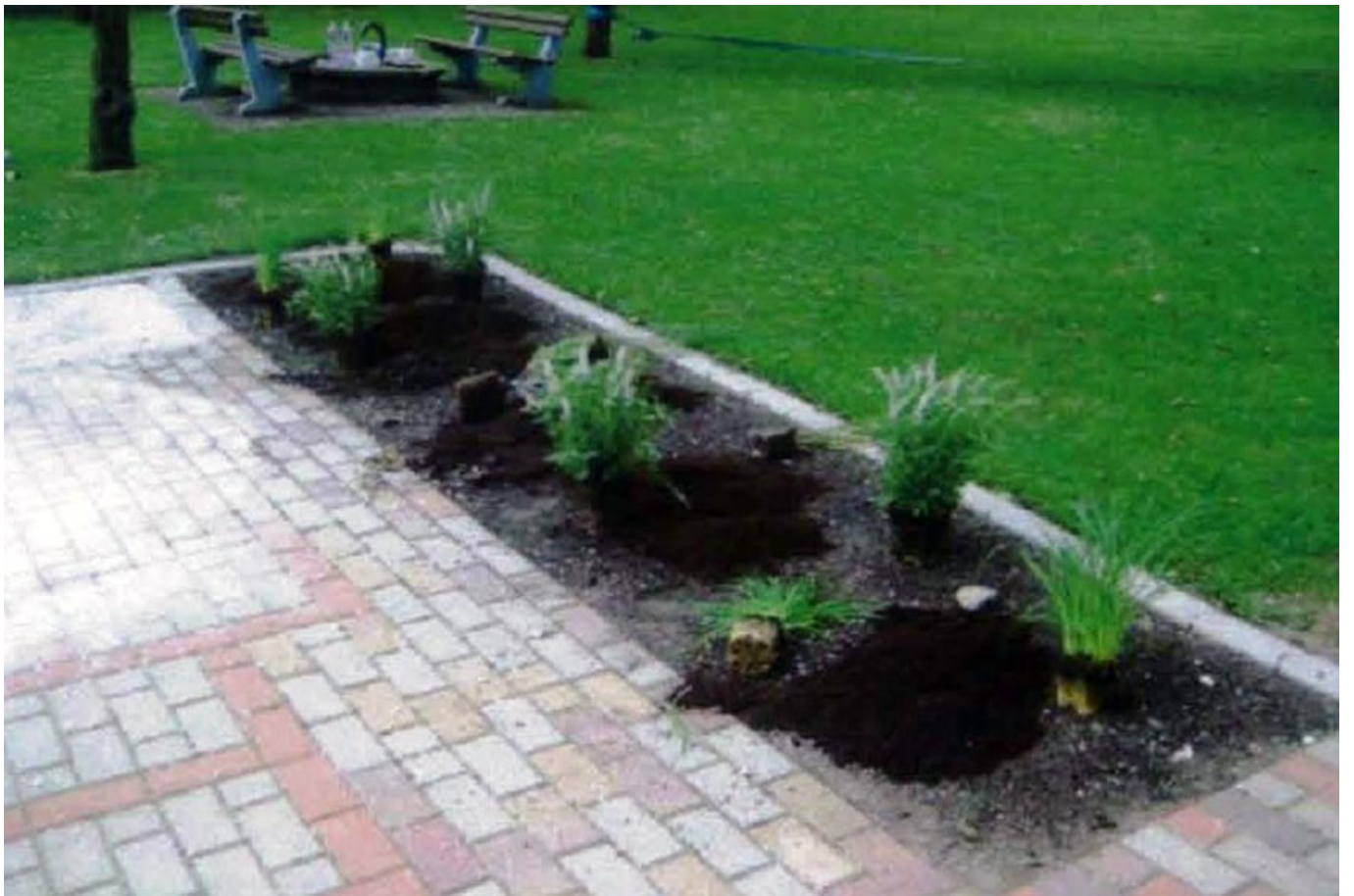
_ VS Dürnbach