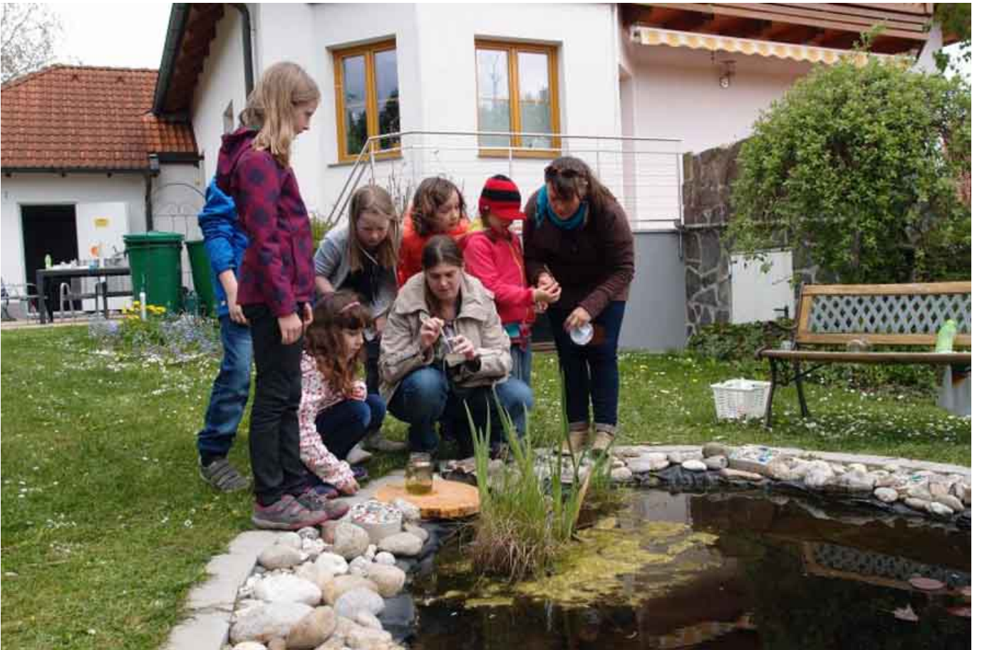
_ VS Waidhofen an der Thaya