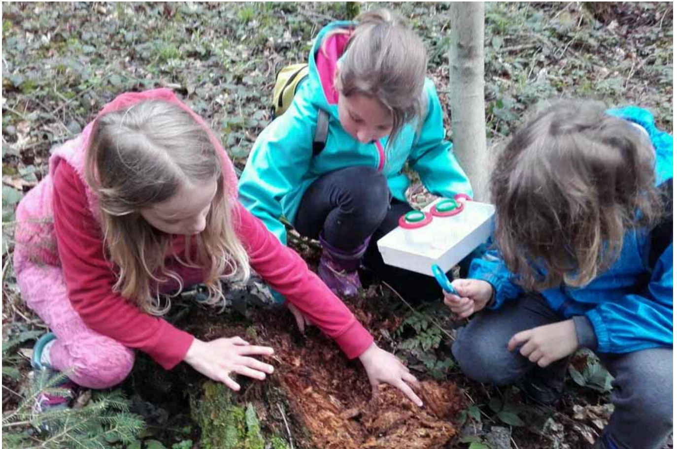
_ VS Waidhofen an der Ypps