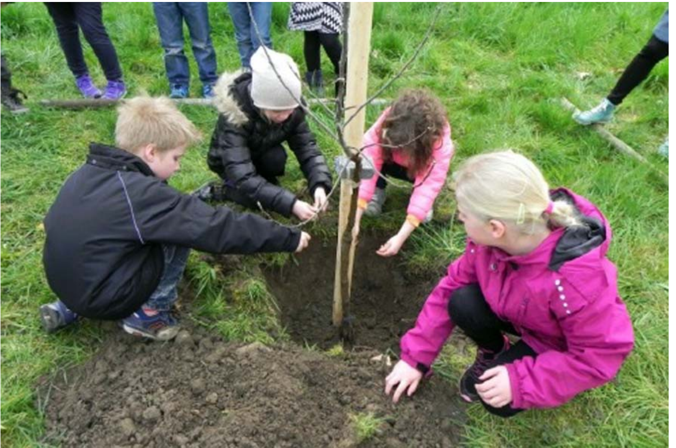
_ VS Montfort