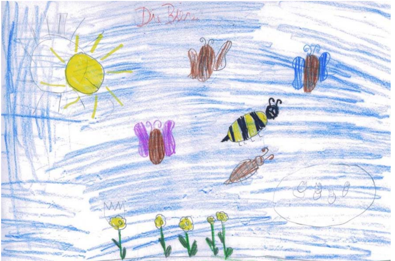
_ VS Aurach "Bienenprojekt"