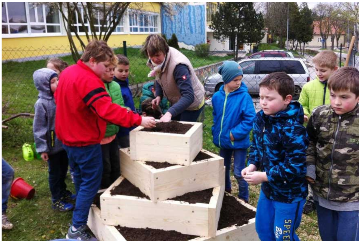
_ VS Sigmundshergberg