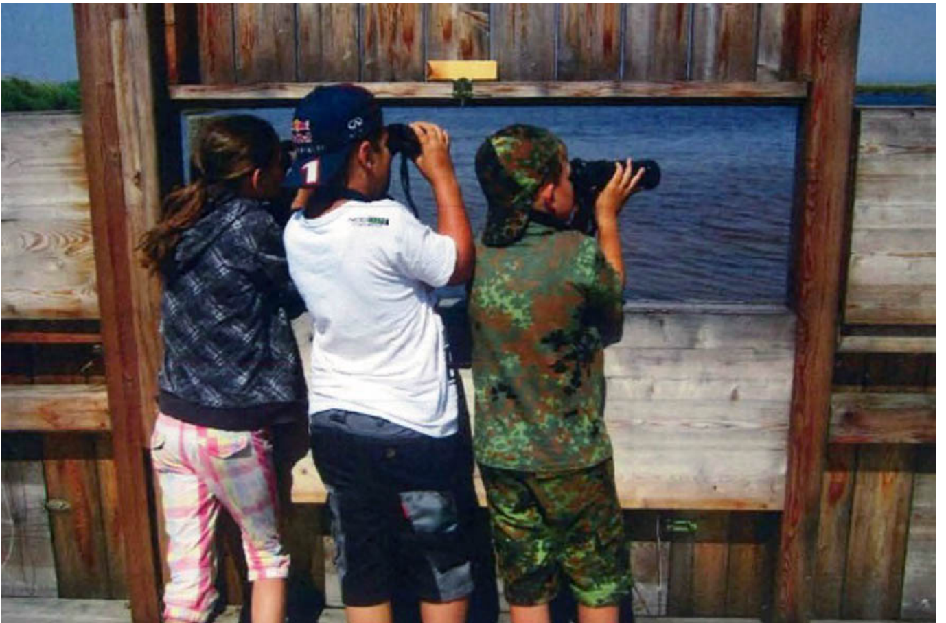
_ VS Mönchhof