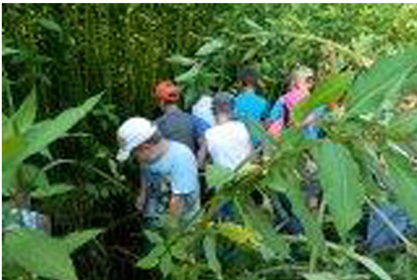
_ VS Leutschach