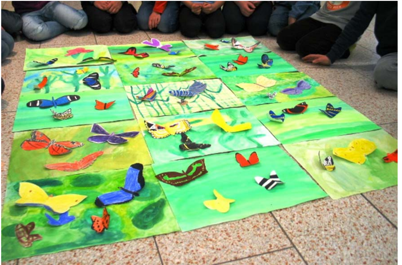
_ VS Hintersee