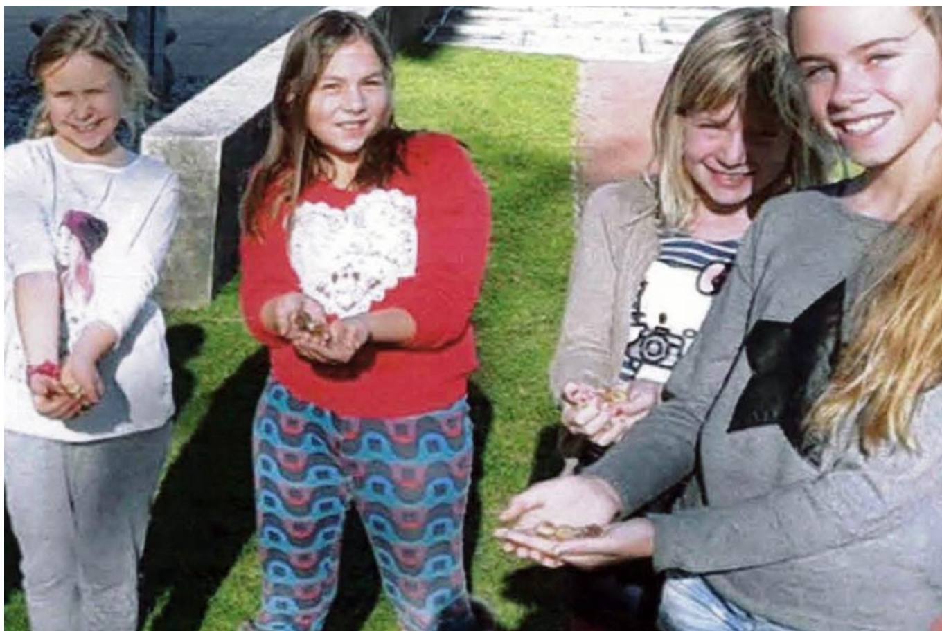
_ VS Kirchberg Tagesbetreuung