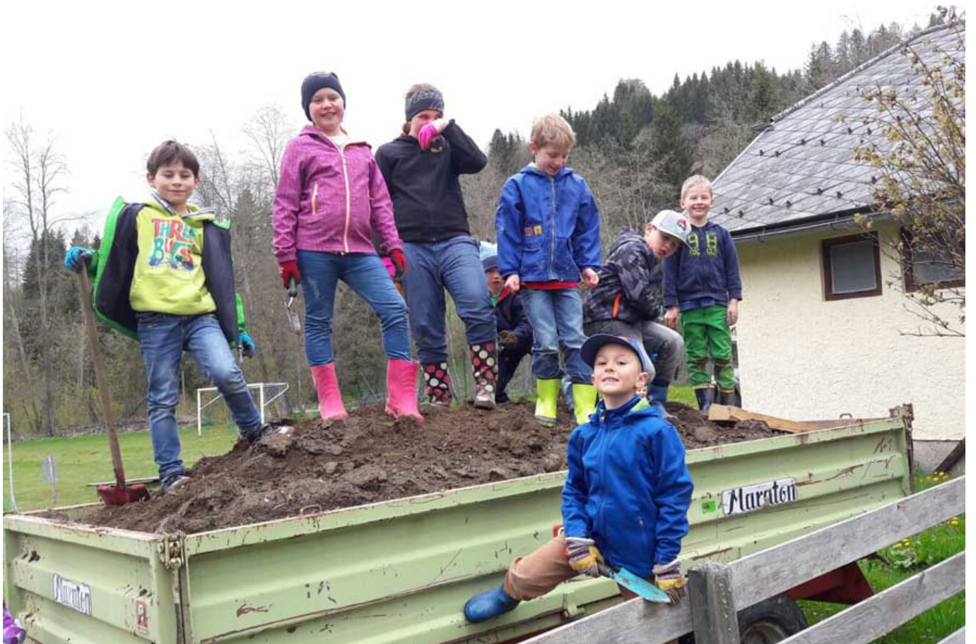
_ VS Seetal