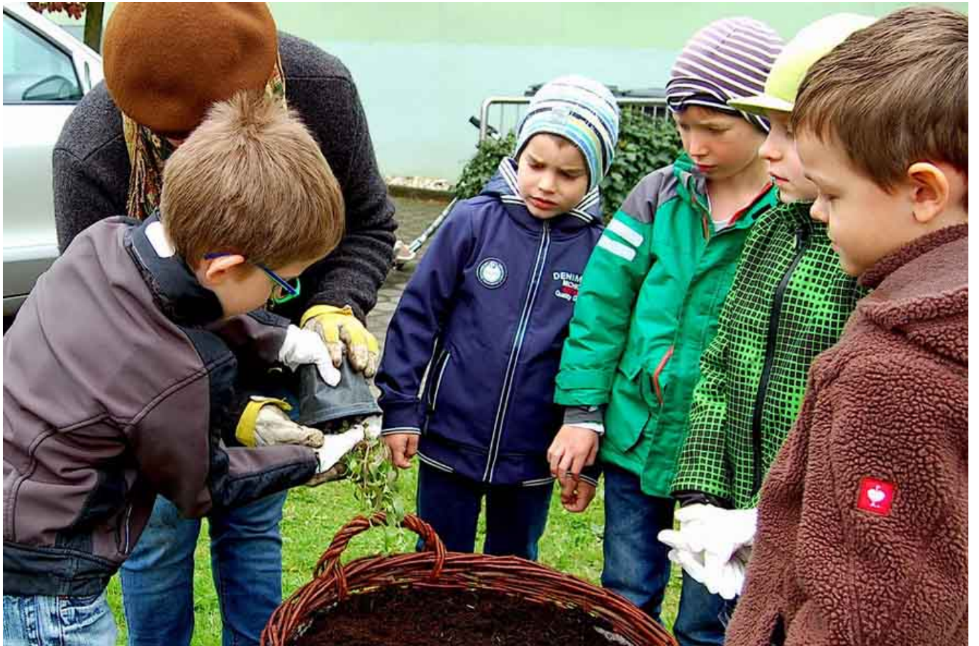
_ VS Wildendürnbach