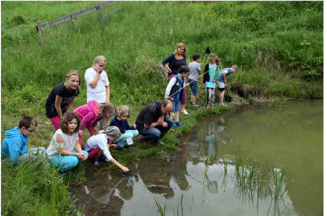
_ VS Hargelsberg