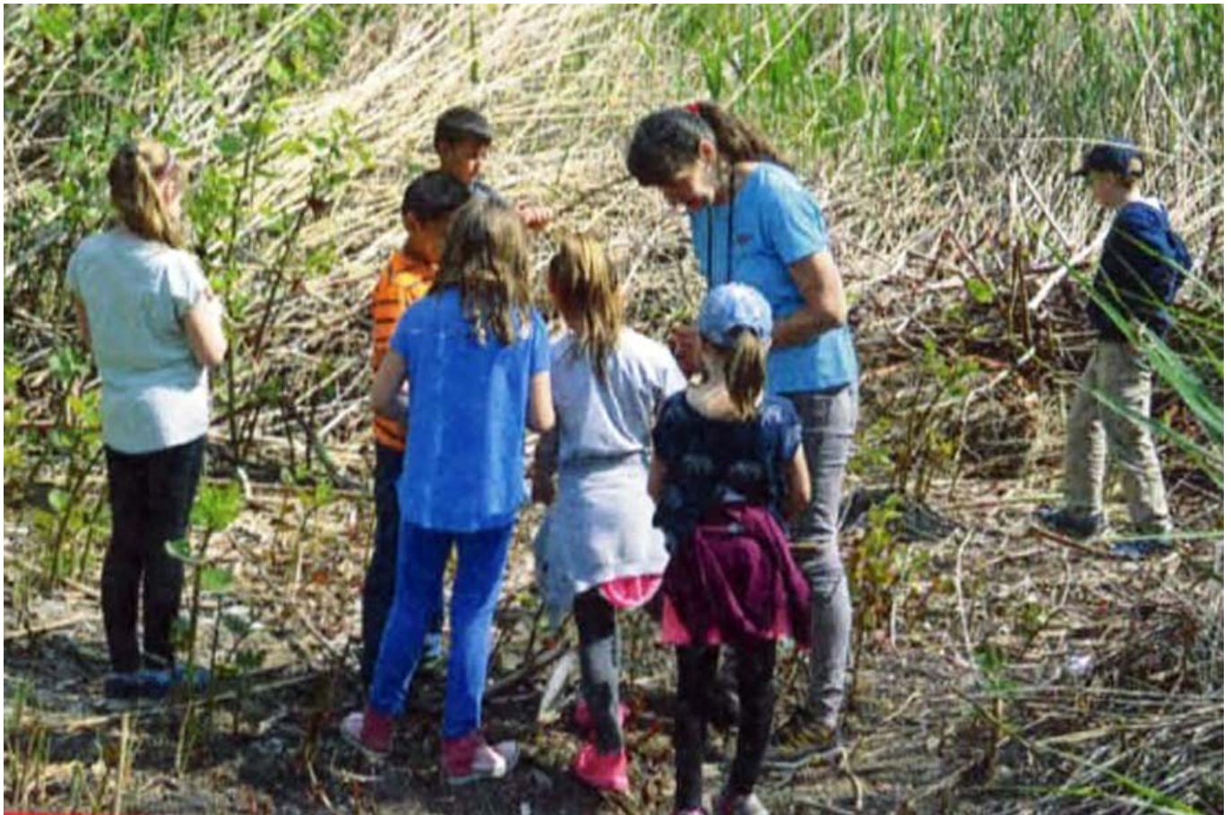
_ VS Mörbisch