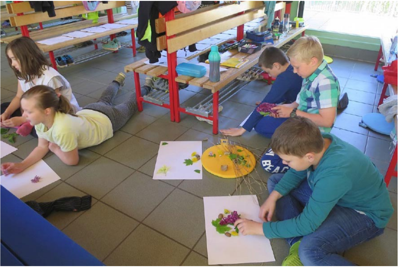
_ VS St. Nikolai im Sausal