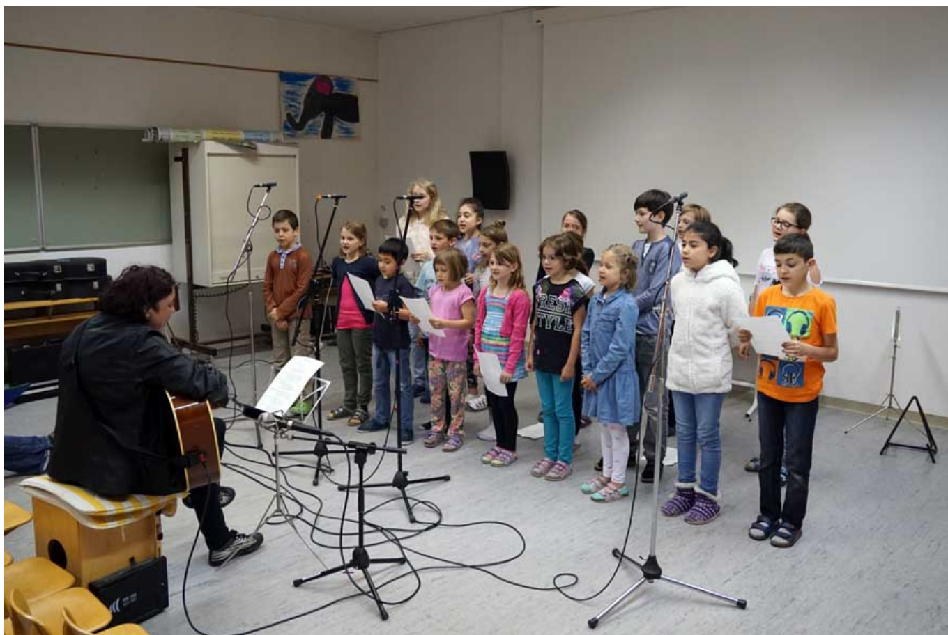
_ VS Haselstauden "Wir sind die Welt"