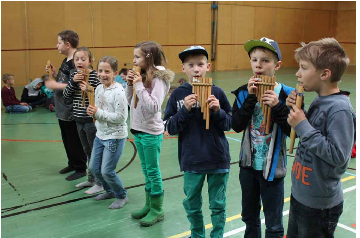
_ VS Eggersdorf