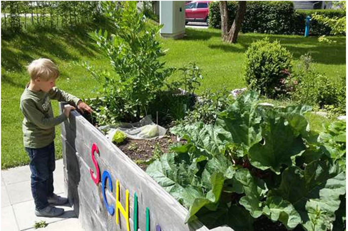
_ VS Pfarrwerfen