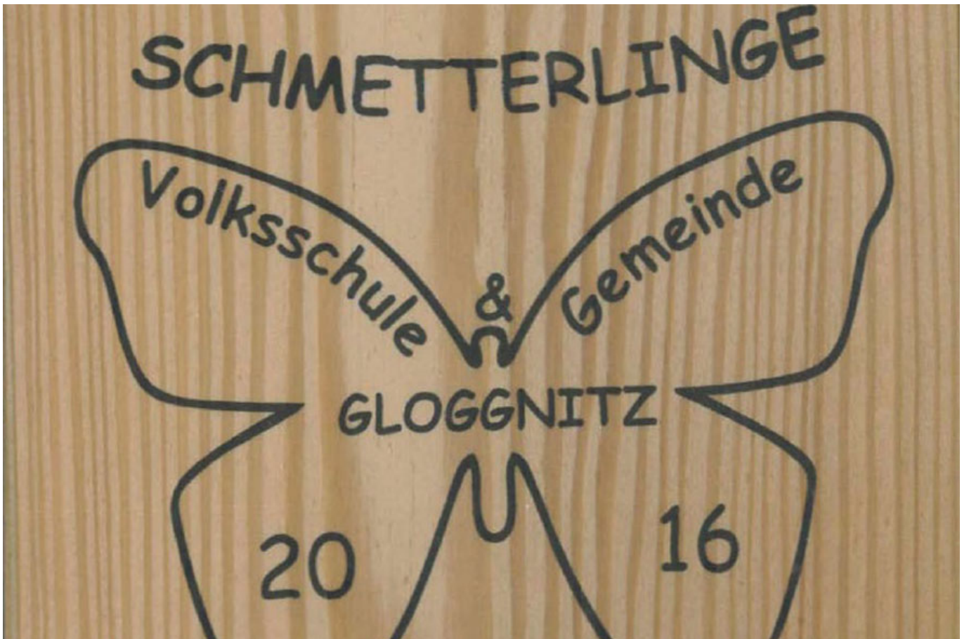
_ VS Gloggnitz