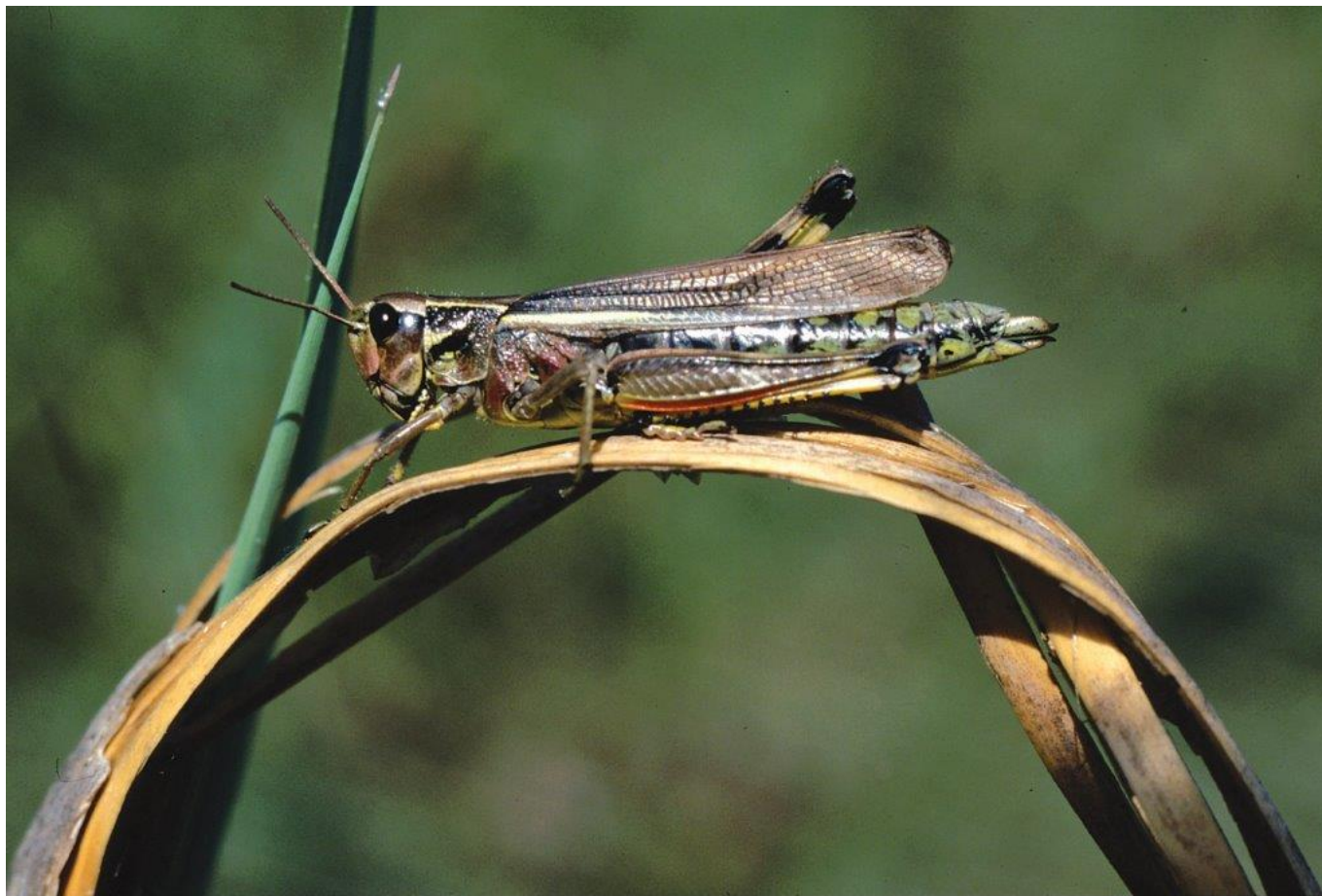
© Sumpfschrecke ( Mecosthetus grossus ), Günther Nowotny